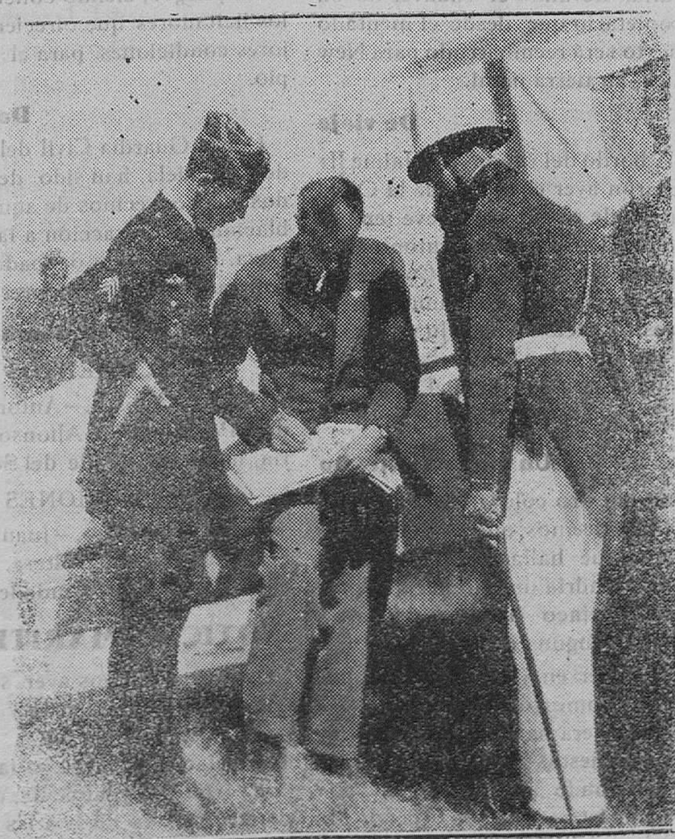
SEVILLA.—La vuelta a Europa en avioneta. — El piloto inglés Butler, primero en llegar a la base, firmando la hoja de control

Aprobar el repartimiento de los conciertos voluntarios y obligato-