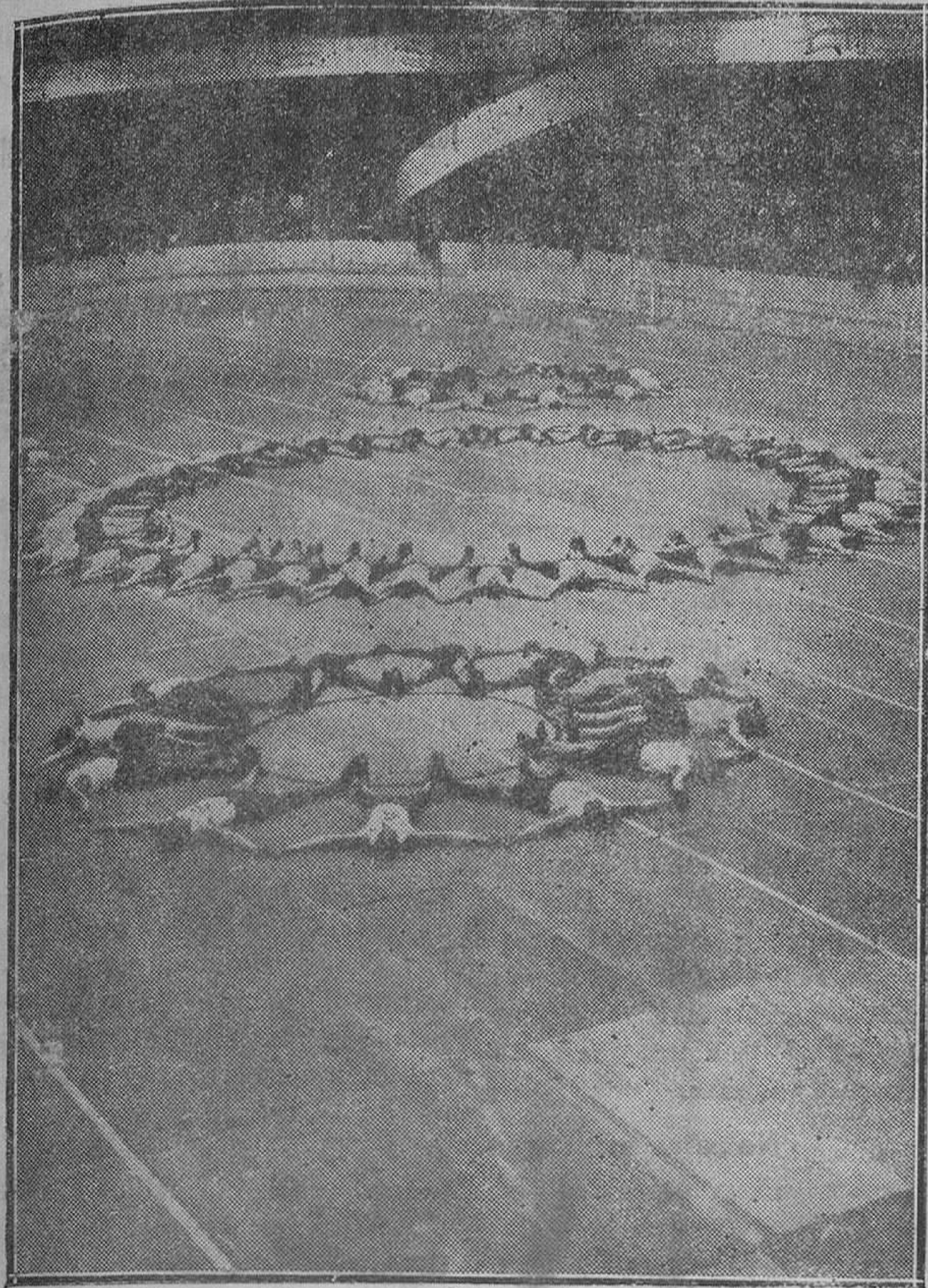
EXTRANJERO.—Deporte bajo tejado.—Los atletas alemanes han celebrado una importante fiesta en el recinto abierto de Sport Palast de Berlín. Una de las curiosas evoluciones de los grupos participantes, para dibujar con sus cuerpos artísticas figuras.

El proyecto no es pura fantasía, ni engendro de imaginaciones calenturientas. Se llevará a la práctica si se forma ambiente a su alrededor, si las personas destacadas de Menorca, las personas de influencia y de dinero responden al llamamiento que se les hará. Como se llevó a cabo el monumento a nuestros héroes, por la energía y generosidad de hombres beneméritos a quienes retribuirá más que la gratitud de sus conciudadanos el testimonio de su conciencia, también ahora, estos mismos y otros hombres no menos beneméritos por esconder bajo la capa de la modestia más admirable las larguezas de su generosidad, llevarán a cabo si se lo proponen la empresa de preparar en Monte Toro un pabellón para practicar los Ejercicios espirituales en épocas determinadas y para hospedar a los buenos