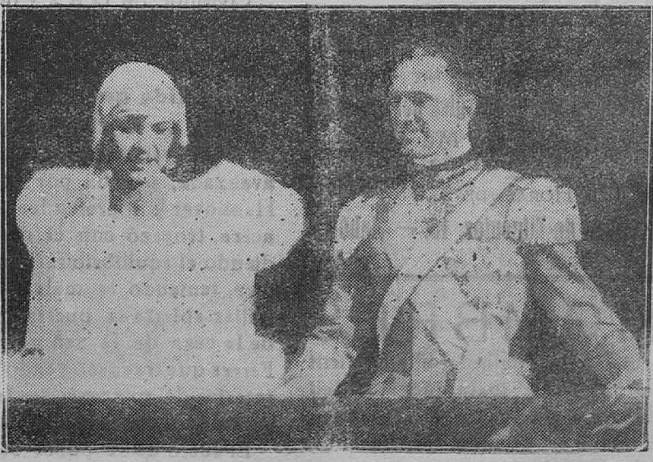
ROMA.—Los Príncipes, asomados a un balcón del Quirinal, saludan a la multitud que los aclama