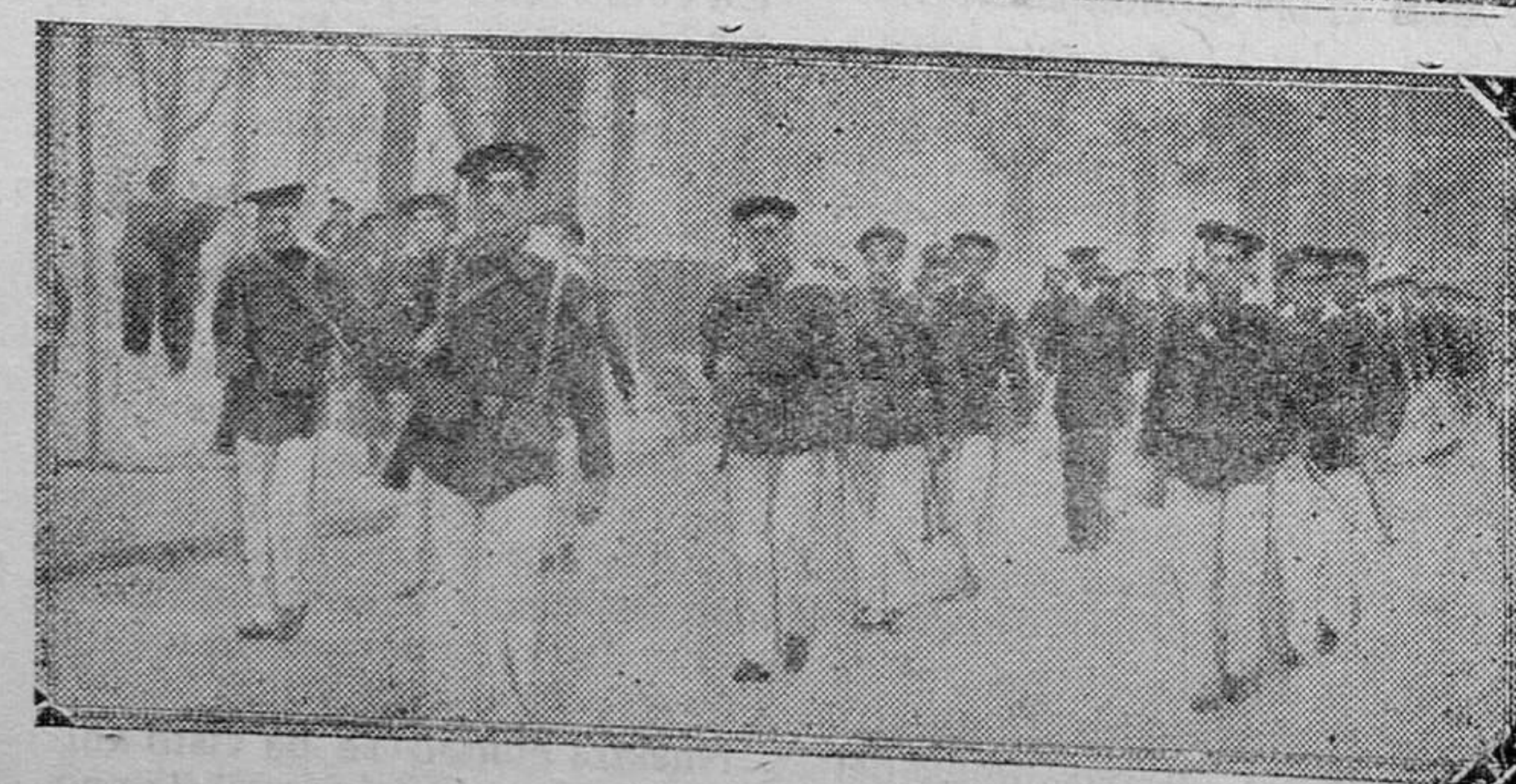
Llegada a Madrid de la Sección de Marina que asistió al desfile con motivo de la proclamación del Presidente de la República Española