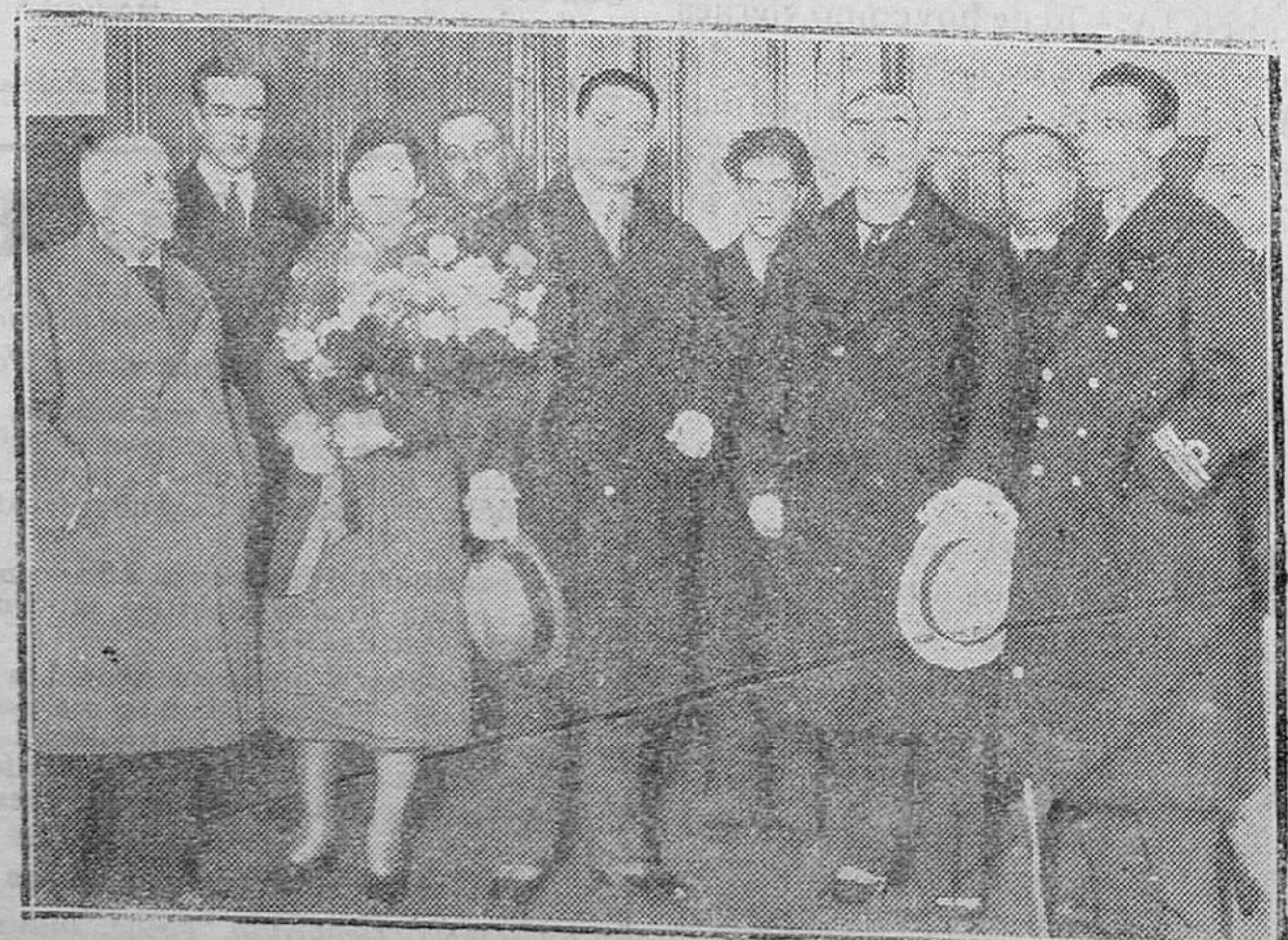
SAN SEBASTIAN. — Don Armindo Monteiro, ministro de Colonias de Portugal, con su esposa y el aviador Gago Coutinho al llegar a Irán, de paso para Portugal, acompañado del Embajador de su país y otras personalidades

Mi considerado señor: Al regresar a Madrid me informan de que