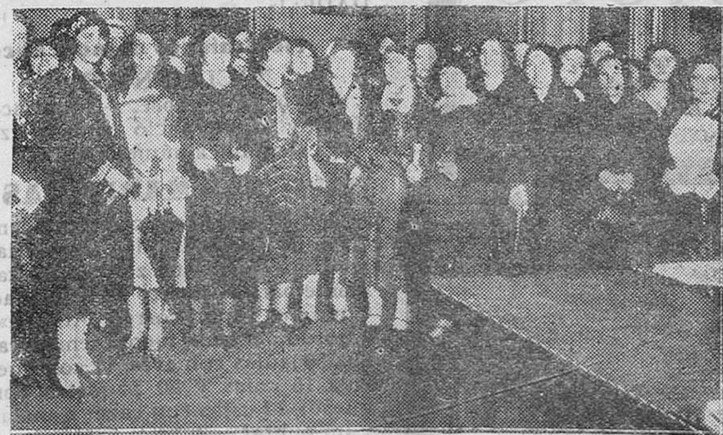
MADRID.—Comisión de damas católicas que visitó al Jefe del Gobierno para pedir la reforma del artículo 24 de la Constitución, relativo a la cuestión religiosa

Esto de somete nos «veis nobis» a un experimento socialista, bajo la dirección de unos hombres que no han hecho hasta ahora sino teorizar con mediana fortuna en el mitin y en la Prensa, es para estremecer si España conservase todavía un poco de la sensibilidad inherente a la salud. Pero ya está visto que el cuerpo nacional adolece de un principio de parásisis.