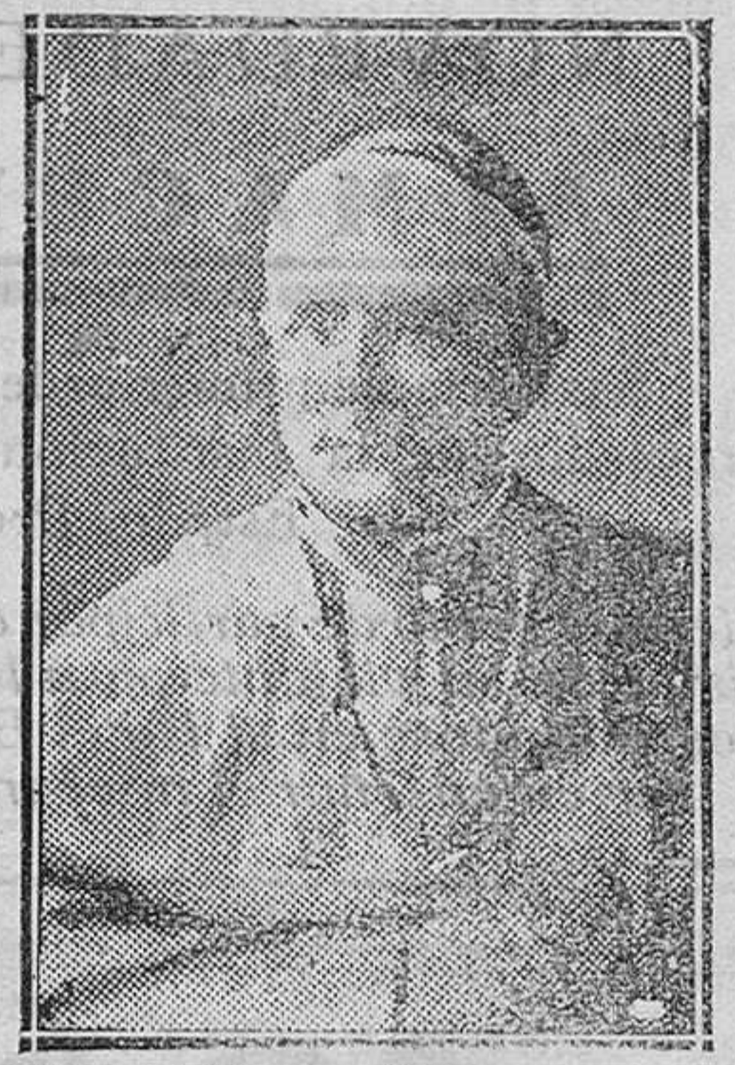
ITALIA.—El Cardenal Ragonessi, fallecido recientemente. Había nacido en Bagina el 21 de diciembre de 1850

repetirse aquí para demostrar lo que puede esperarse, sobre todo en un periodo de luchas y enconos como el que estamos viviendo, de esa masa de hombres agrupados para decidir de los destinos de una nación. Ese mismo tránsito sentimental del pesimismo al optimismo de quien, por sus estudios, por su formación intelectual, debería no registrarse nunca más que por los dictados del cerebro, como el señor Besteiro, es la mejor demostración de lo que decimos. Cuando él es un sugestionado más, ¿qué les pasará a los que no son más que vulgo? (De «La Correspondencia Militar»)