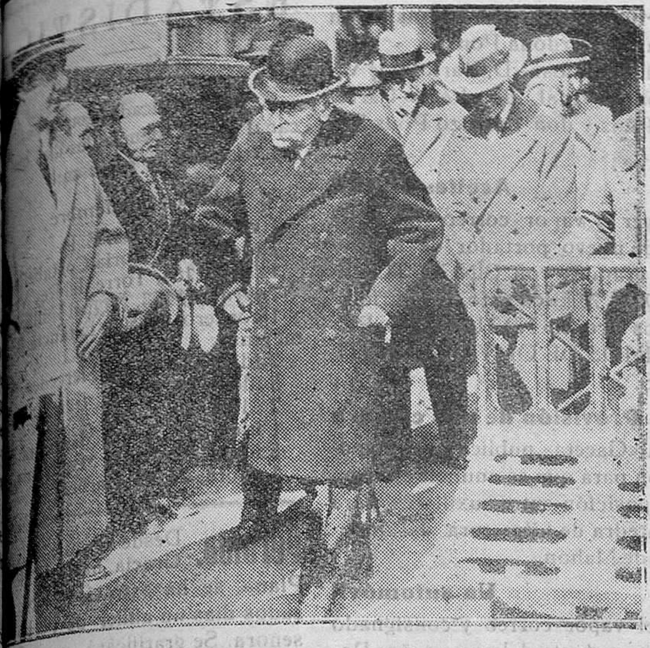
Aristides Briand, fotografiado en la Estación de Lyon al marchar para Ginebra con objeto de intervenir en la Asamblea de la Sociedad de las Naciones