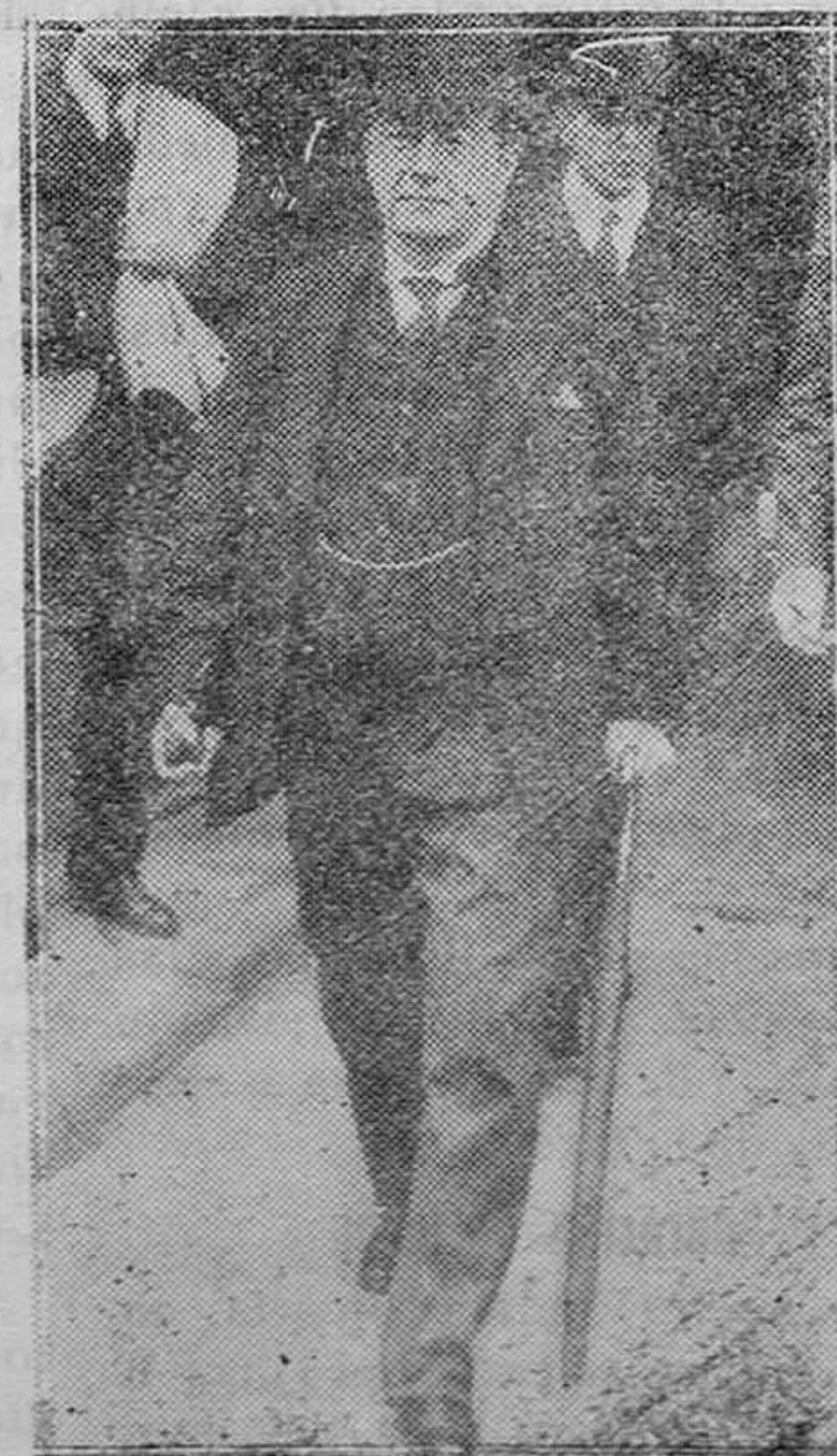
El jefe del partido conservador inglés, Mr. Stanley Baldwin, saliendo del mitin organizado por dicho partido en el Kingsway Hall, el día anterior a la formación del nuevo Gobierno británico

Qué lección de humildad tan provechosa nos da Jesucristo al final de su Evangelio cuando recordando la soberbia de los fariseos en escoger los primeros puestos, terminó con aquella sentencia tan conocida y tan sabia: el que se ensalza será humillado. Cuantos vemos en nuestros días que buscan con apasionada soberbia los primeros puestos y se entretienen, sin ser llamados a mangonear en los cargos más difíciles y distinguidos, todo con el solo fin de sa-