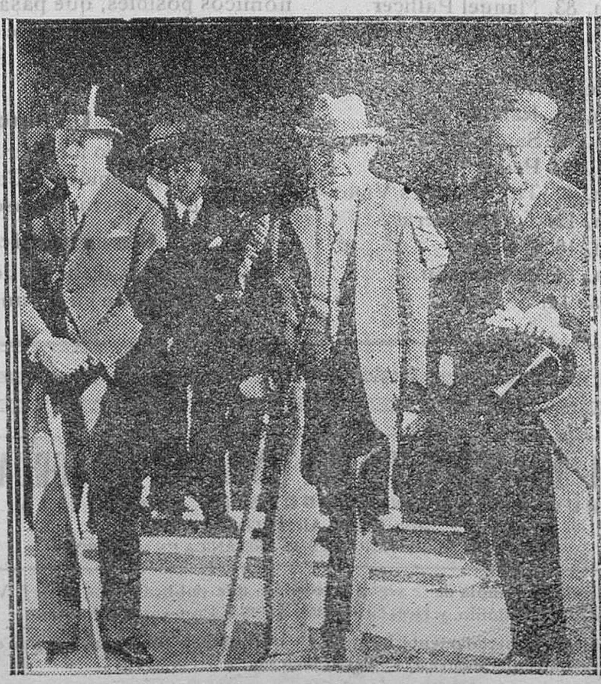
EXTRANJERO.—El ministro de Negocios Extranjeros británico Mr. Hendersson en el momento de llegar a la estación de Friedrichstrasse, acompañado del Embajador de su país en Berlín Mr. Rumbold y del doctor Curtius

Terminó el ilustre filósofo su discurso, y los queridos compañe- ros de Prensa se lanzaron sobre las personalidades principales en demanda de un juicio acerca del mismo. ¿No habría sido más curio- so preguntar al orador el juicio que había formado de los oyentes? La autoridad, el renombre, las cualidades oratorias, el poder de sugestión del señor Ortega y Gas- set, realizaron el milagro; pero, por eso mismo, quienes después hemos meditado acerca del dis- curso, estamos en condiciones de decir a aquél: — Señor Ortega y Gasset: usted no tiene derecho a desorientar a la opinión, y en el párrafo principal, dedicado a las reformas militares, la ha desorien- tado. El elogio a las reformas del se- ñor Azaña, que ya llevó a cabo en las columnas de la Prensa el señor Ortega y Gasset, y ahora ha com- pletado en el Parlamento, es total- mente injusto, porque es totalmen- te erróneo. La bondad de unas reformas mili- tares, sólo puede nacer de una de estas dos cosas: primera, razón económica que reduce los gastos militares de la nación a las posibi- lidades financieras del Tesoro; se- gunda, razón técnica u orgánica que proporciona al Ejército un máximo de eficacia con un mínimo