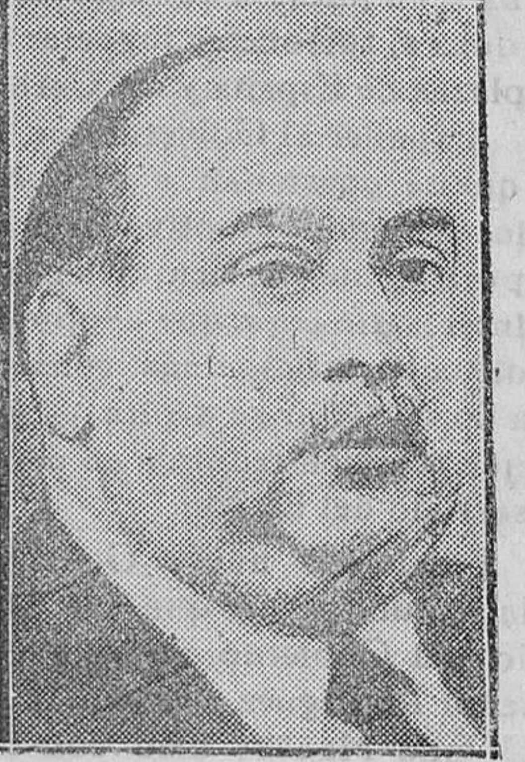
Don José M.ª Cid, ministro de Comunicaciones