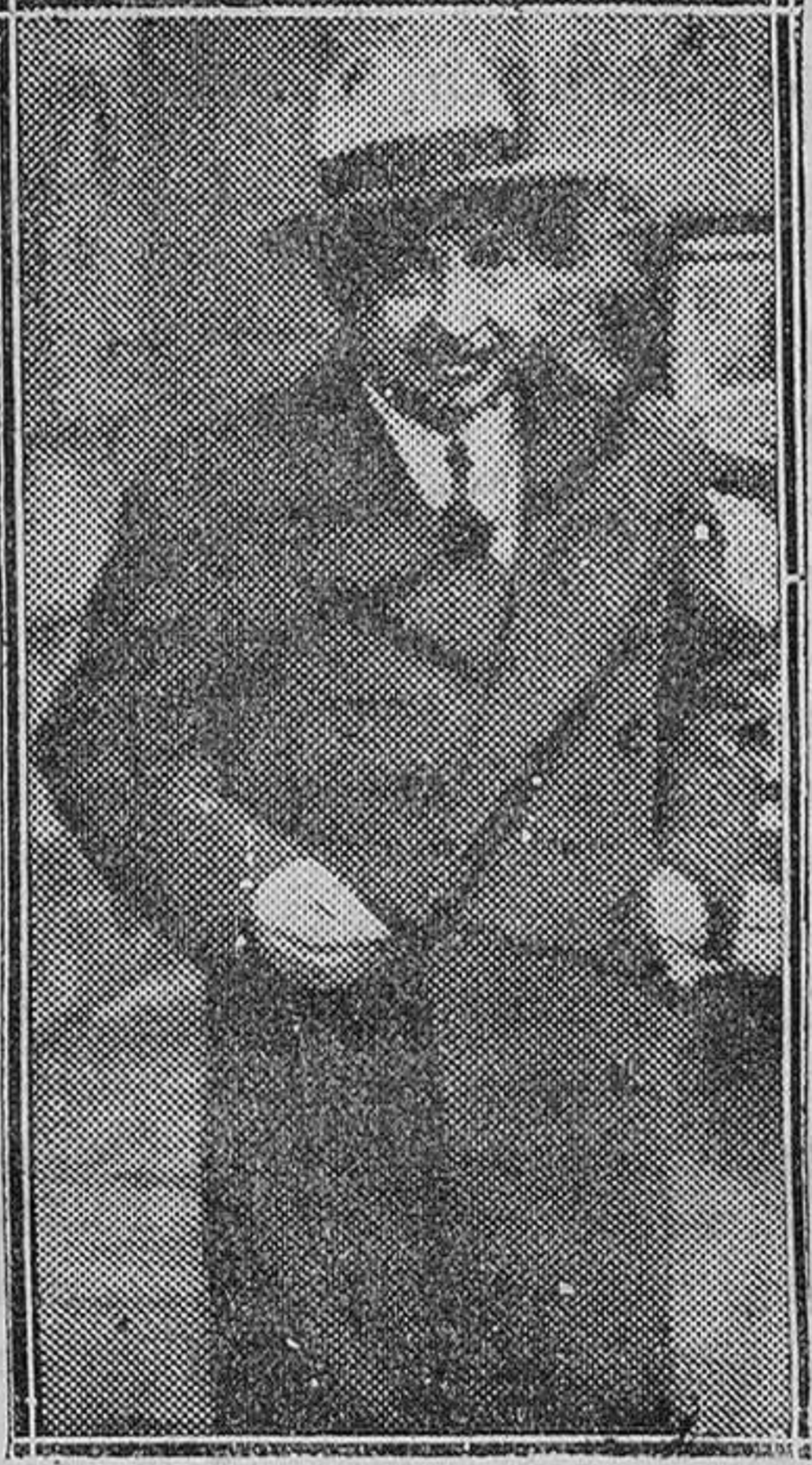
MADRID.—El señor Botella Asen al salir del Consejo celebrado en Palacio en el que dimitió su cargo de ministro de Justicia.