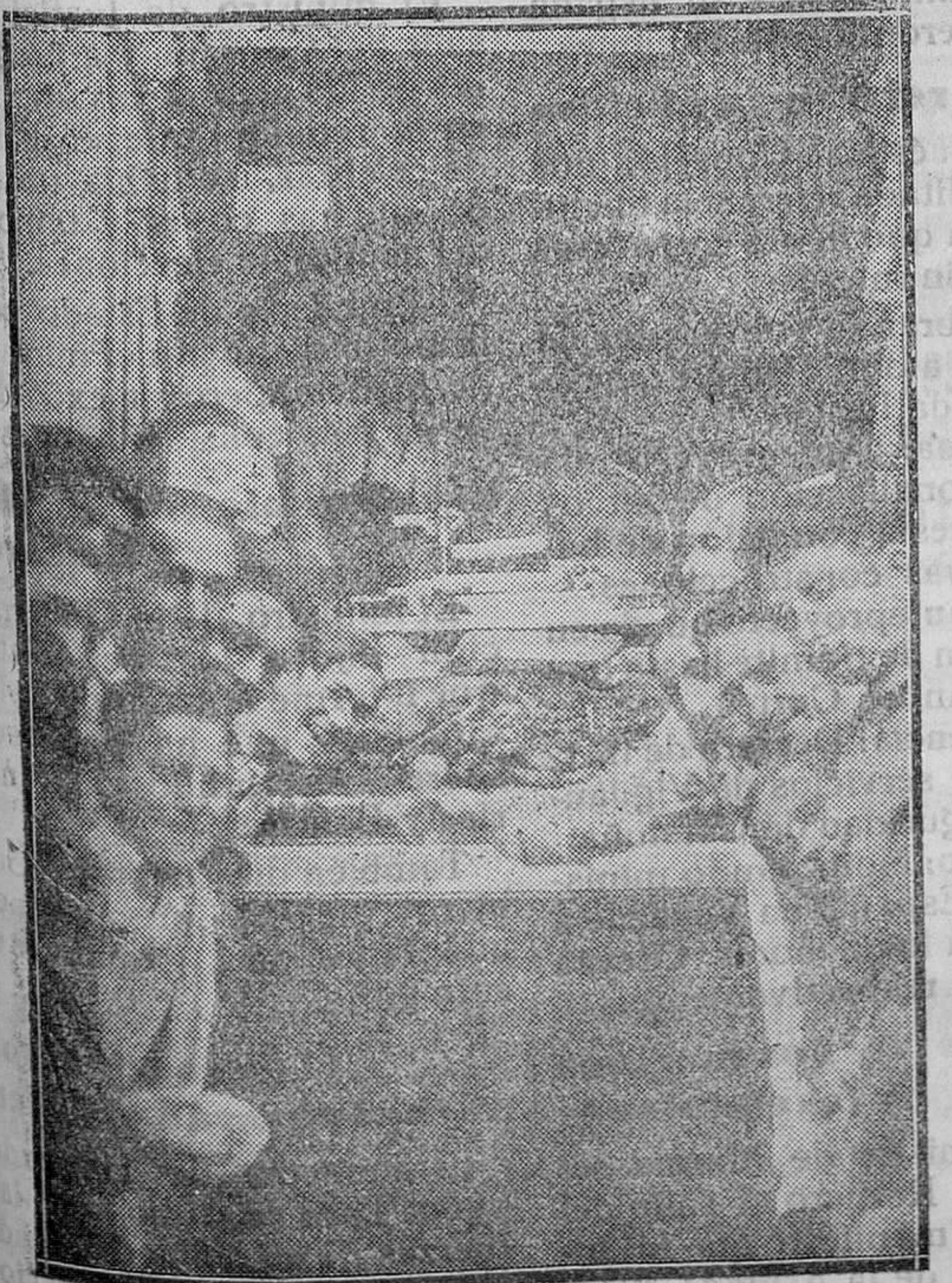
MADRID.—El escaparate de la carnicería de la calle de Bravo Murillo que ha sido asaltada y de la cual se llevaron varios jamones y chorizos en pleno día

Las Cámaras Oficiales de Comercio e Industria (o de Comercio e Industria en su caso), remitirán a la Dirección General de Comercio y Política Arancelaria, antes del 15 de enero de 1934, una relación comprensiva de todos los exportadores que, de acuerdo con el párrafo anterior, hayan hecho