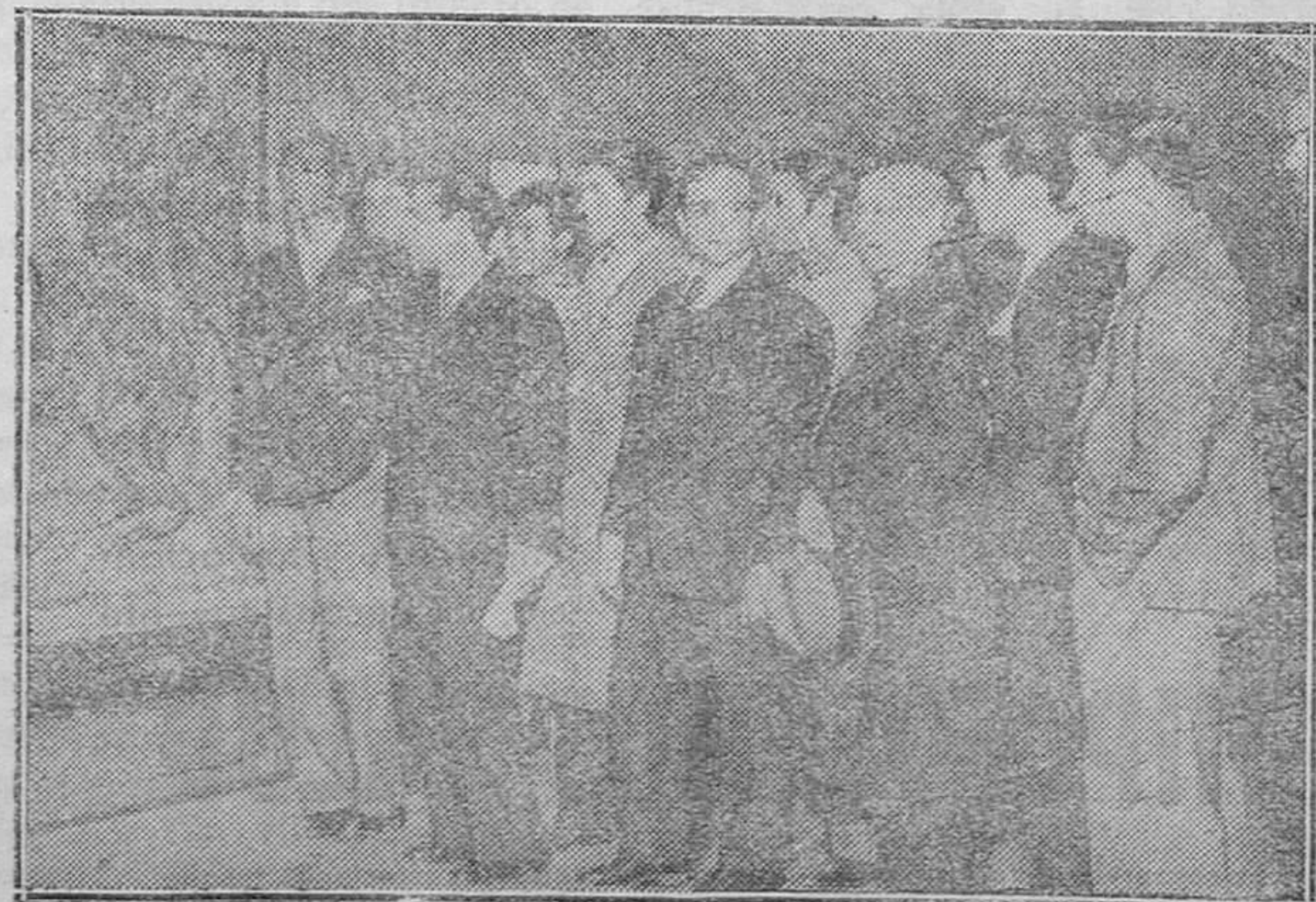
MADRID.—Inauguración de la Exposición de Escultores y Dibujantes regionales en el Museo de Arte Moderno