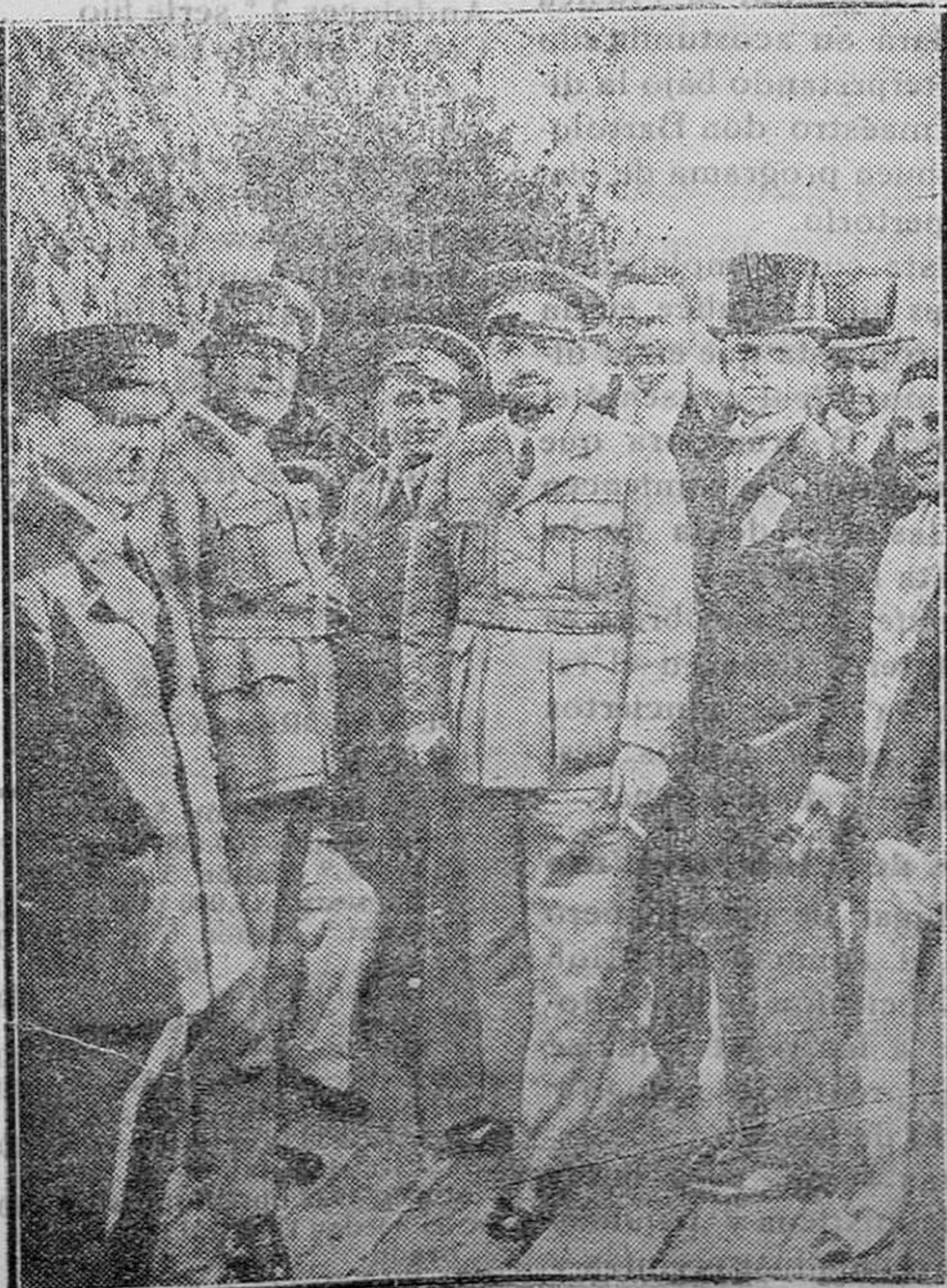
El general Baibo a su llegada a Shediak, en donde fué recibido por las autoridades canadienses

—El tiempo excesivamente caluroso, y como todos los años en