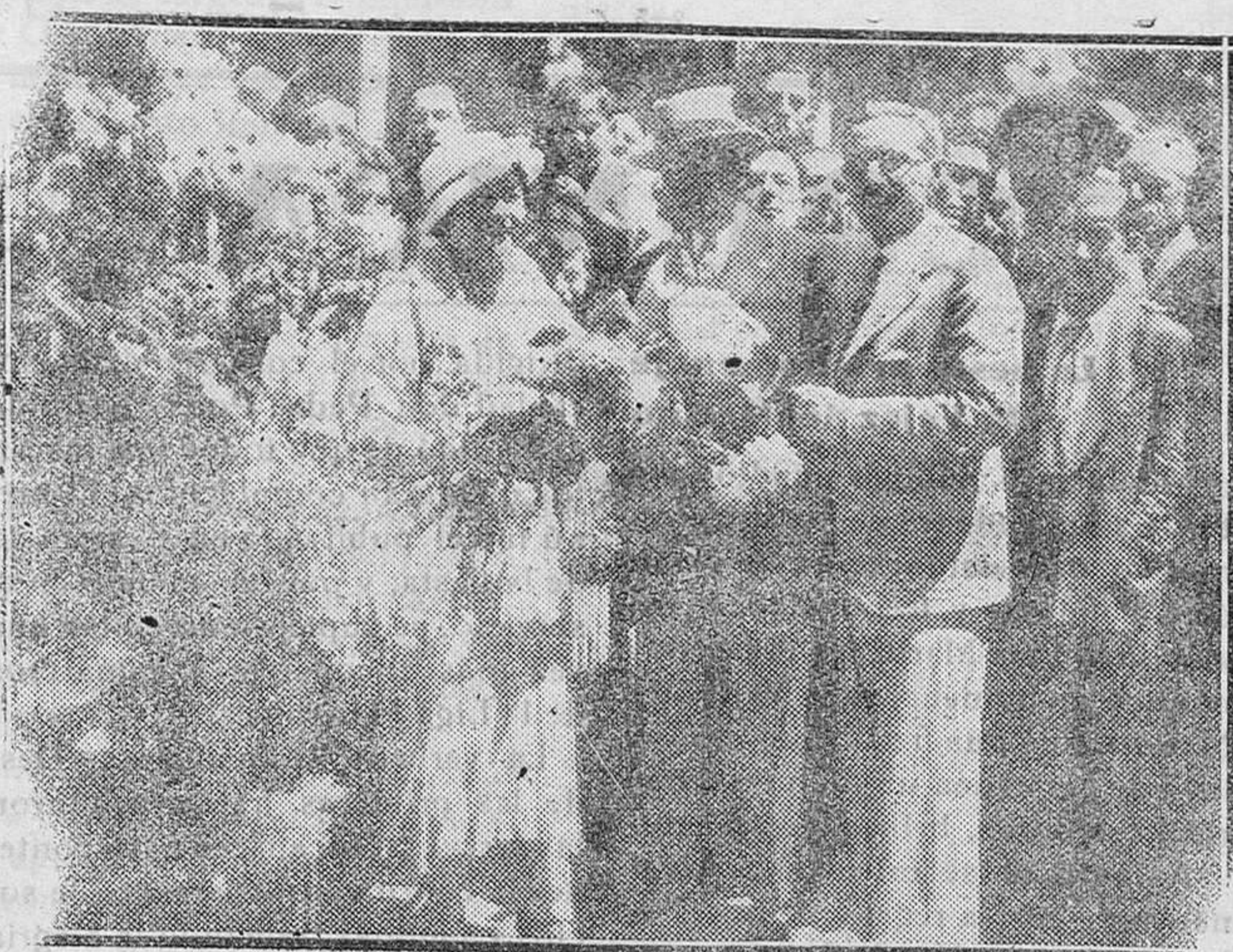
MADRID.—Inauguración de un mercado de flores en la plaza de Santa Bárbara