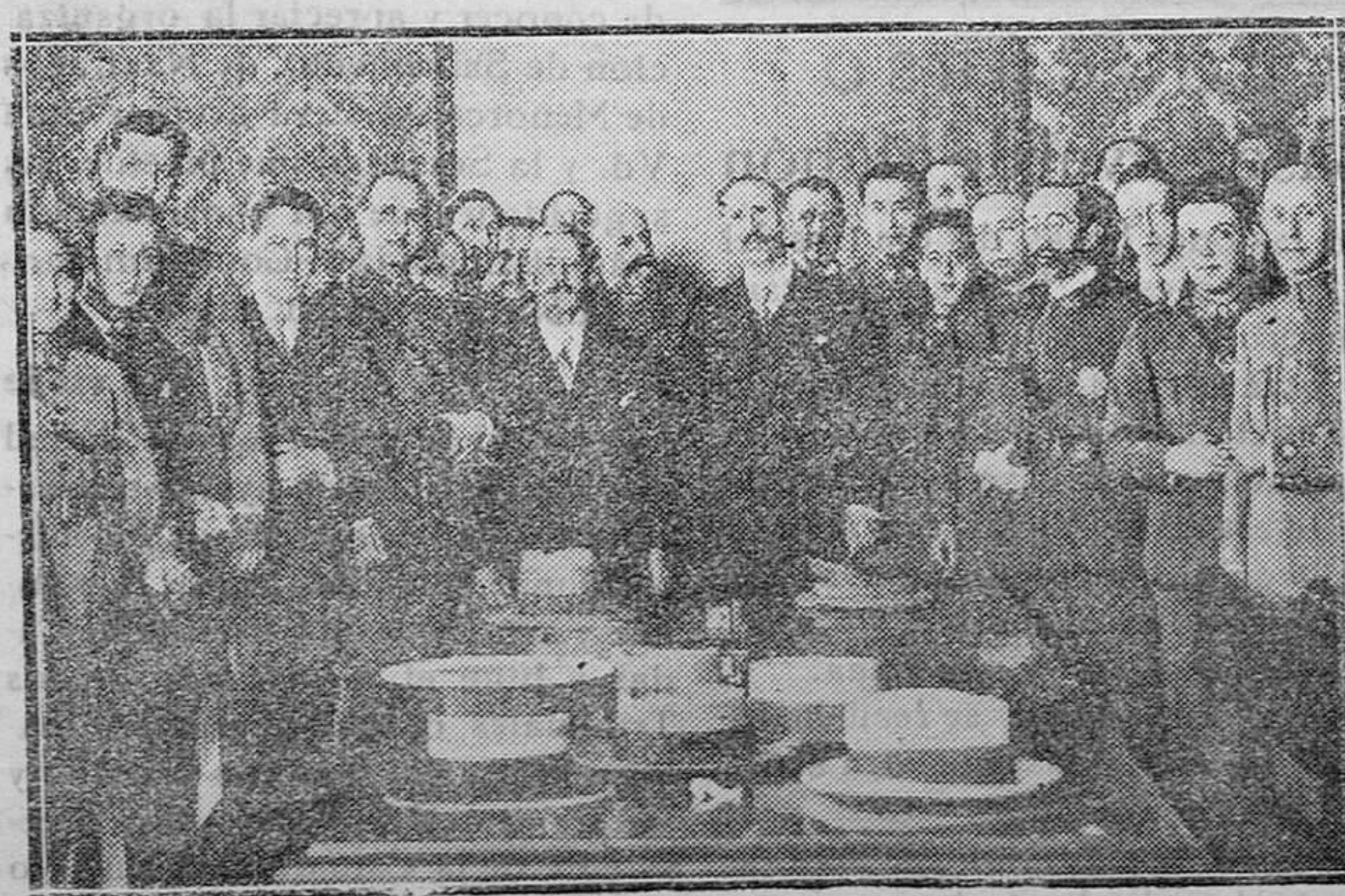
La vista por los sucesos de Agosto. Grupo formado por los procesados antes de reunirse la vista del proceso