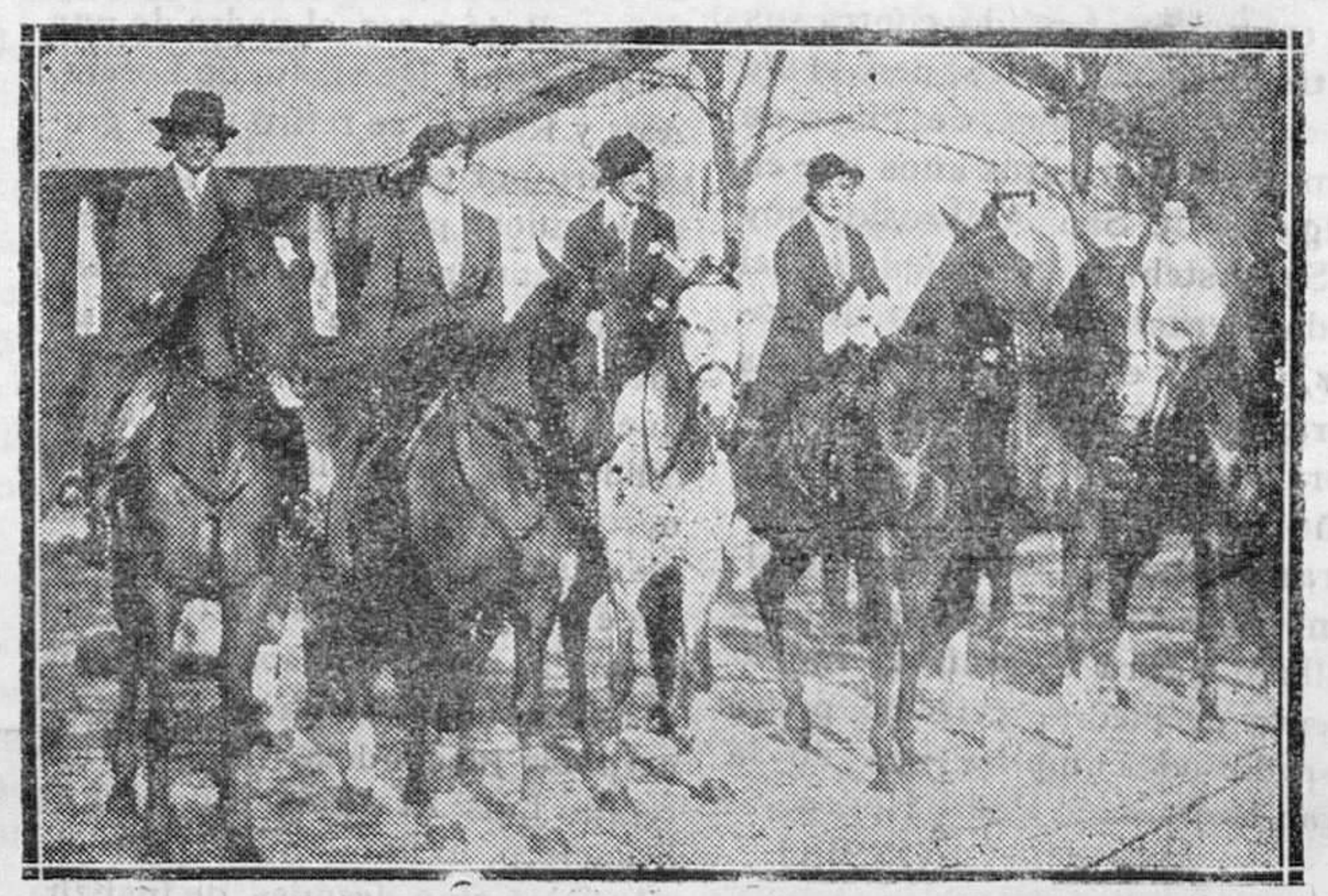
En la Casa de Campo y en la Sociedad Hípica se celebró una «Gymkhama», en la que tomaron parte las amazonas que se ven en la foto.