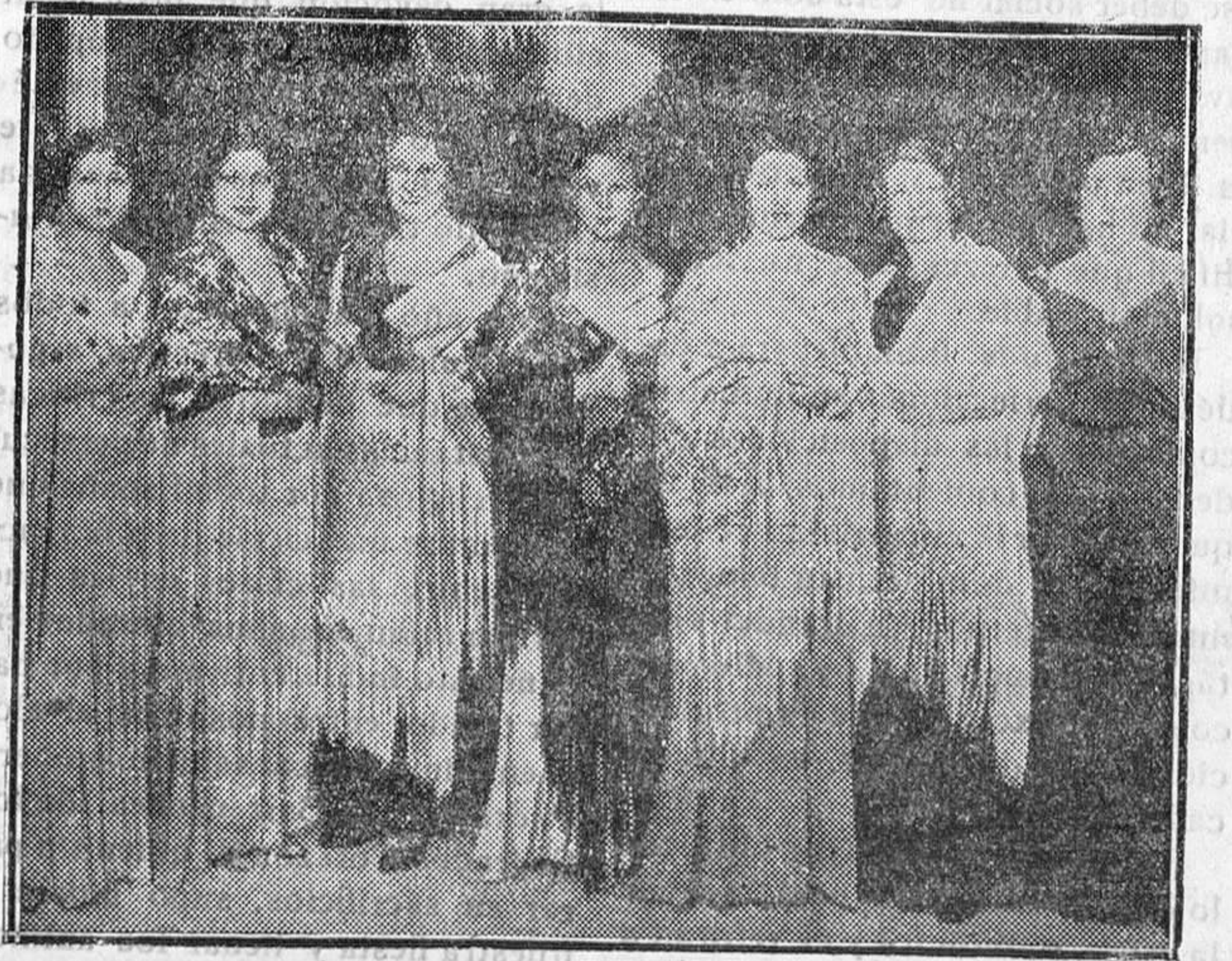
MONTEPIÓ DE ACTORES.—En la Comedia, grupo de concurrentes al baile del Montepío, con asistencia de numerosas artistas y actores