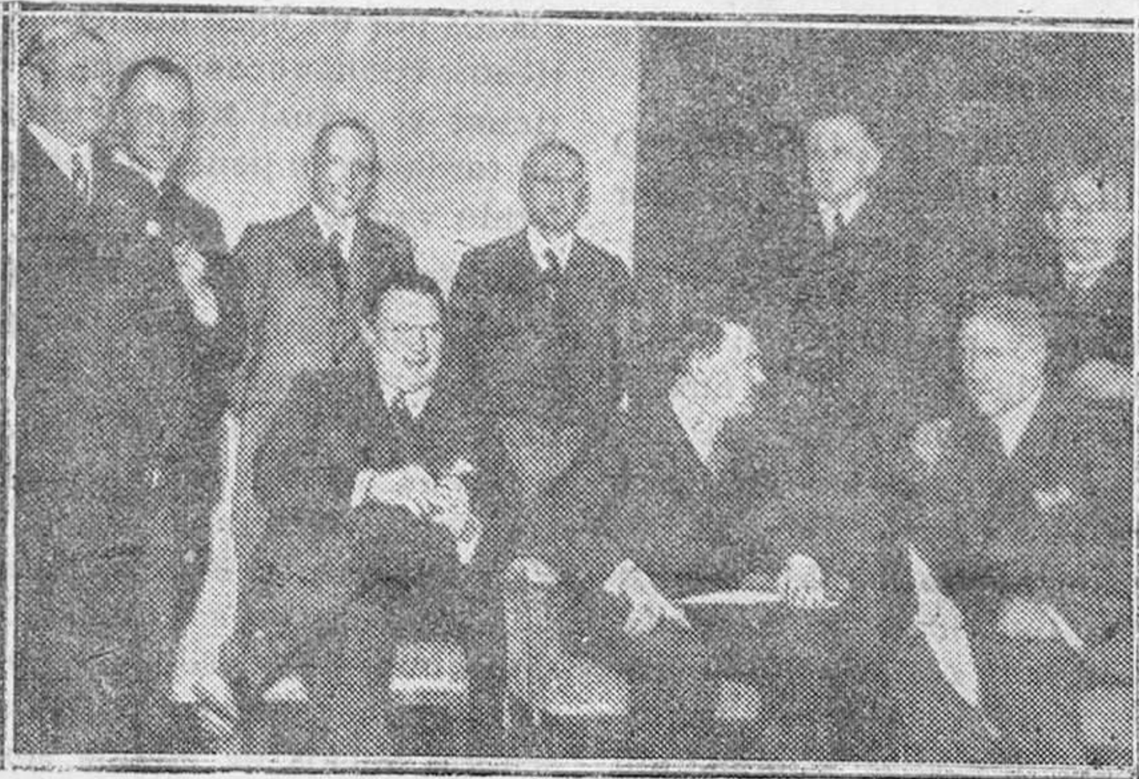
ALEMANIA.—El nuevo jefe del Gobierno, Hitler, rodeado de los ministros