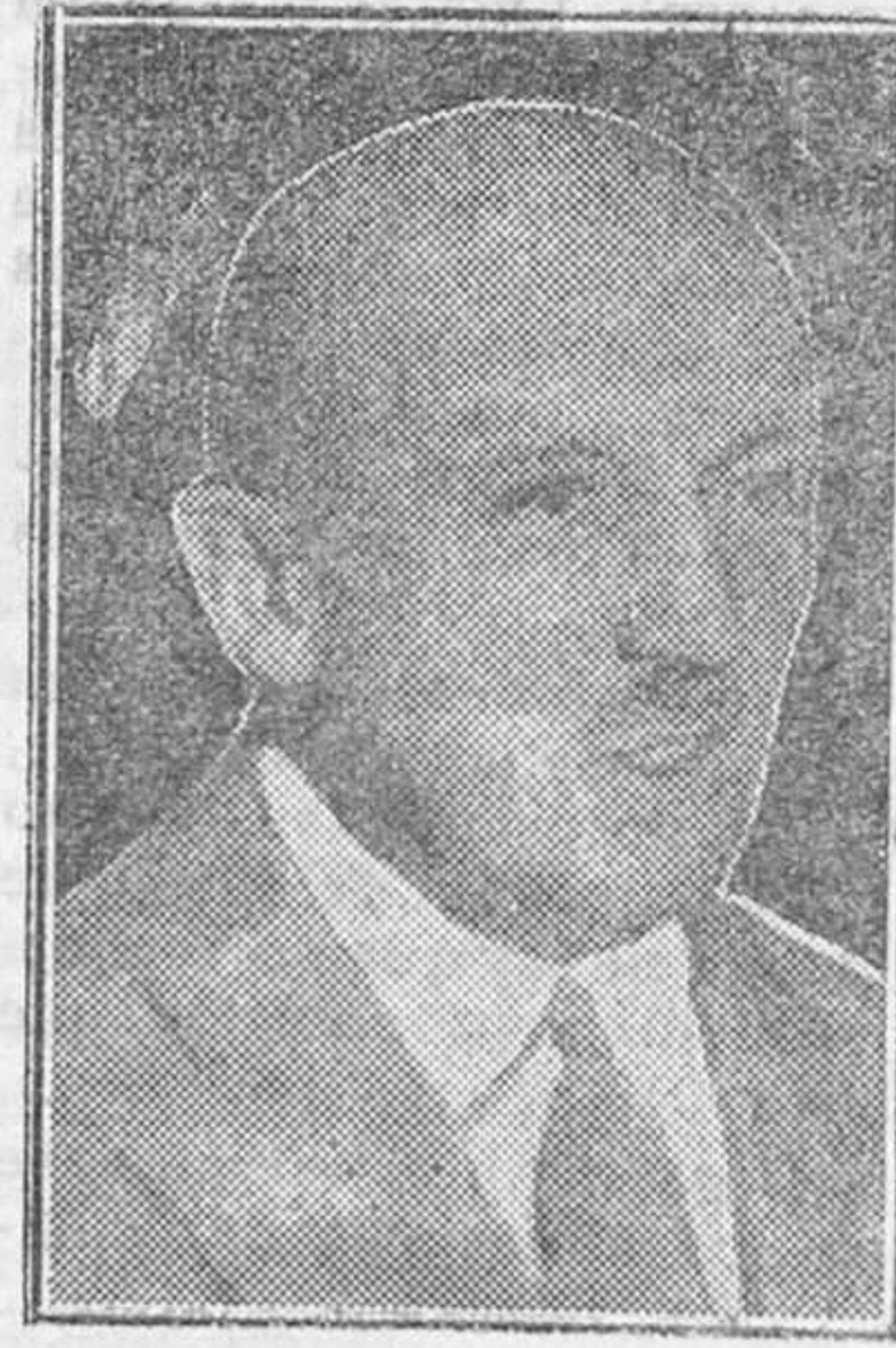
El general Schleicher, que presentó la dimisión del Gobierno al presidente del Reich alemán, al obtener la conformidad del mariscal Hindenburg para la disolución del Reichstag