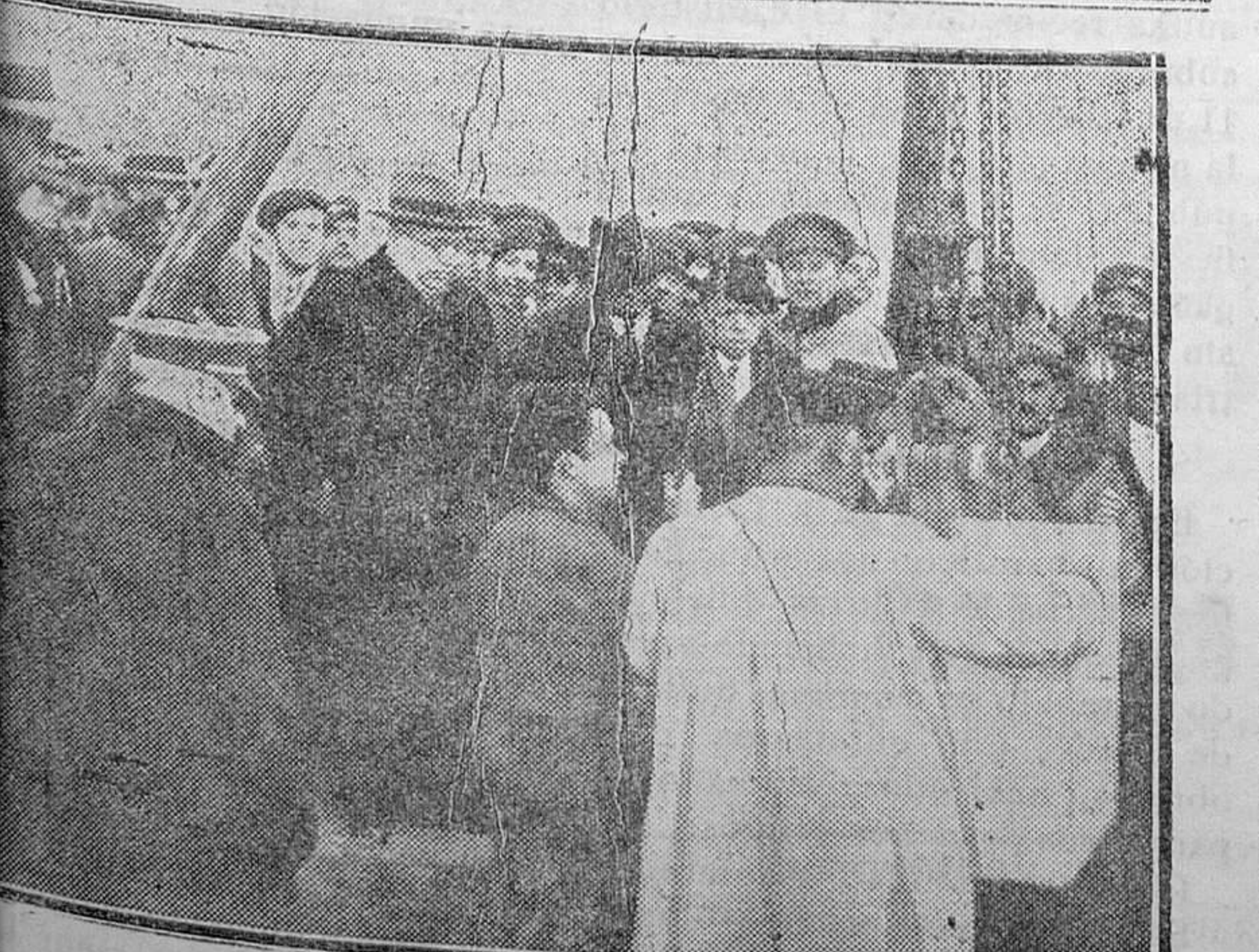
El señor Azaña poniendo la primera piedra en donde se construirán los cuarteles de «El Goloso», con una capacidad para tres mil soldados en el término de Fuencarral

Un pobre judío alemán, materialista y ateo, sin profundos estudios sobre el espíritu y la moral, sin largas vigiliadas consumidas en meditaciones sobre las grandes virtudes y la religión, se erige en rector del mundo y en redentor de los oprimidos, y empieza, para descubrir las características de su temperamento y de su fin, por atacar el odio a unas clases sociales contra las otras. Es evidente que hay en el mundo desigualdades; es evidente que unos seres son superiores, o debe serlo para el hombre que medita con sentido colectivo, que no toda inferioridad es producida por el abuso y la injusticia de la clase superior, que la naturaleza no ha sido con todos los seres igualmente pródiga, y que el medio infalible para que todos se miren como hermanos y marchen unidos, mano con mano, a la con-