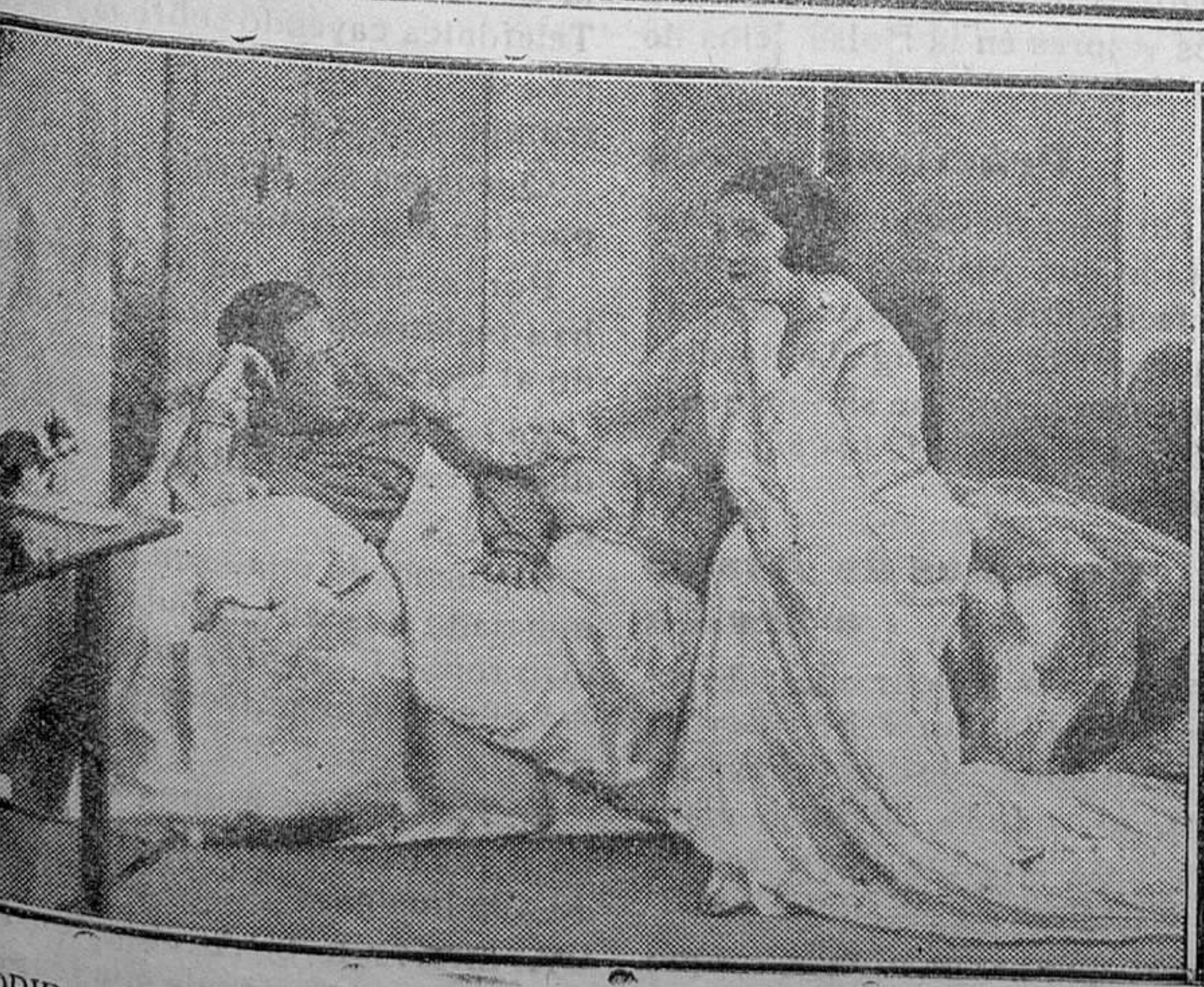
MADRID. — Una escena de «El balcón de la felicidad», comedia de Honorio Maura, que se estrenó en el teatro Fontalba con gran éxito.