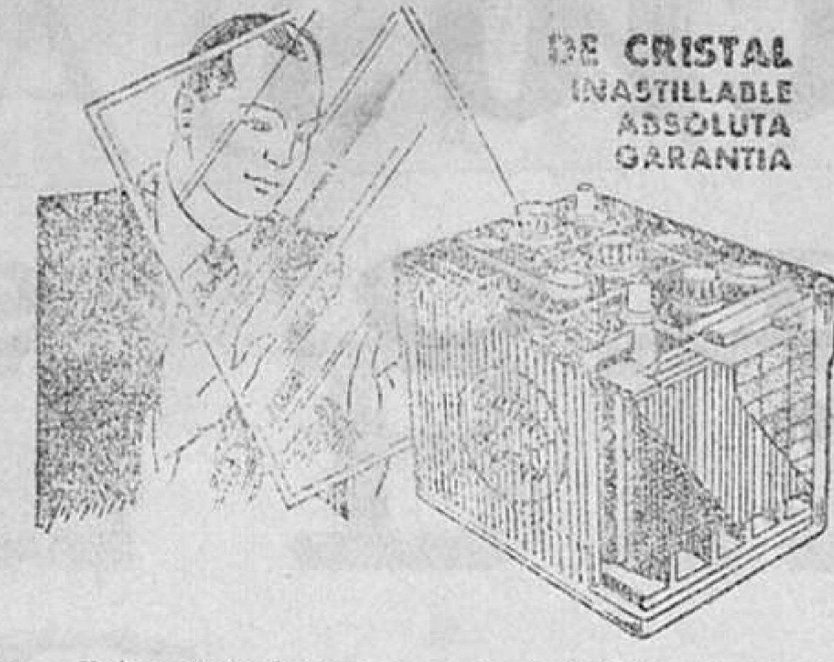
Único Acrombiador con esta de Cristal que permite ver el interior... ABSOLUTA GARANTIA