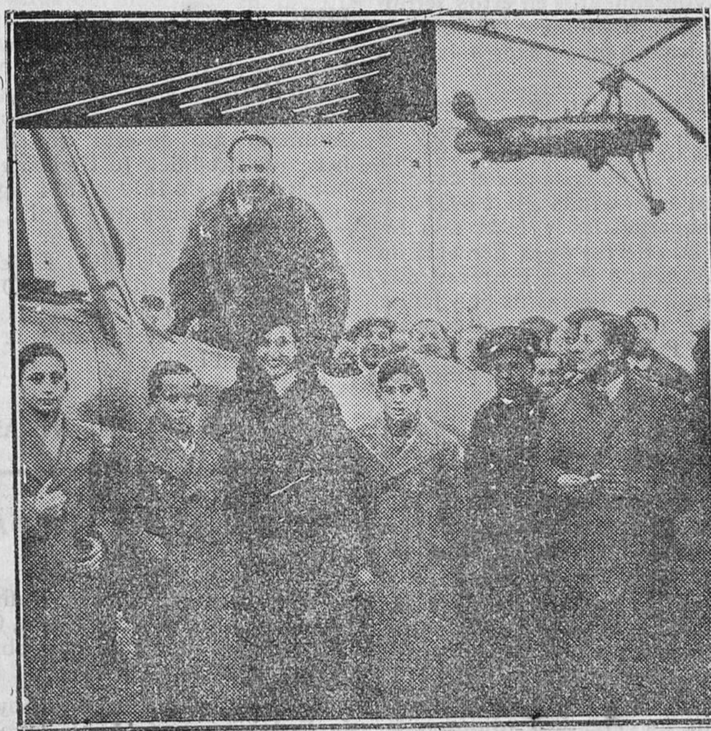
MADRID.—El ilustre ingeniero don Juan de Lacierva a su llegada al aeródromo de Barajas