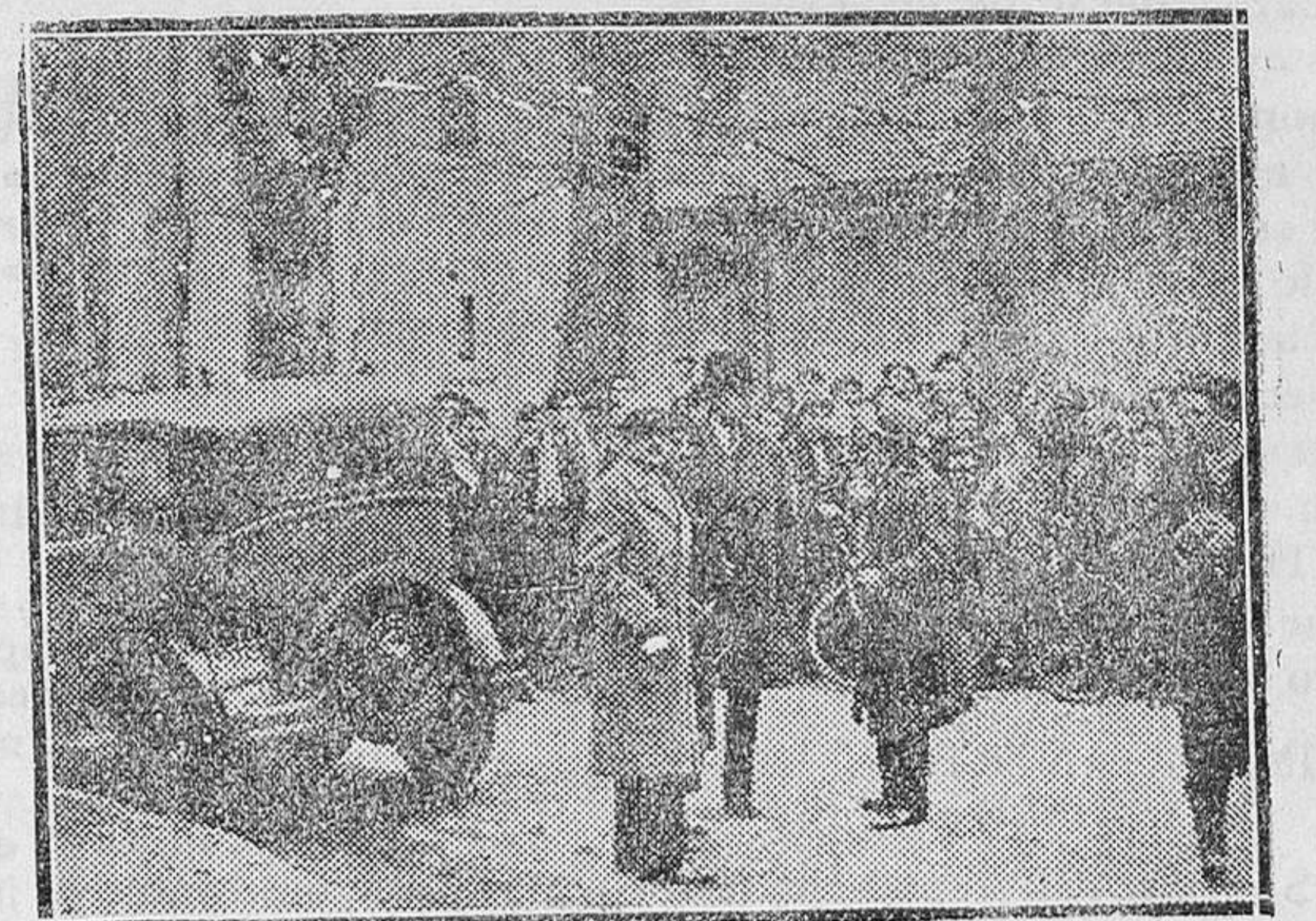
MADRID.—A la salida de un mitin.—Incidentes en la Plaza del Angel