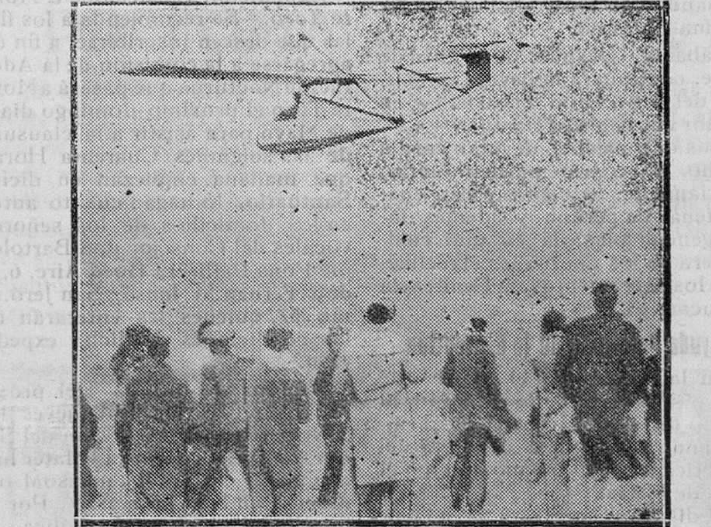
MADRID. Vuelos sin motor.—Un planeador realizando un vuelo sobre el campo de aviación, manteniéndose en el aire 2 minutos

que el mismo Padre os ama, porque vosotros me amasteis y habréis creído que yo salí de Dios. Salí del Padre y vine al mundo: otra vez dejo al mundo y vuelvo al Padre. Sus discípulos le dicen: He aquí que ahora hablas claramente, y no dices ningún proverbio. Ahora conocemos que sabes todas las cosas, y que no es misterio que nadie te lo pregunte; por esto creemos que has salido de Dios.