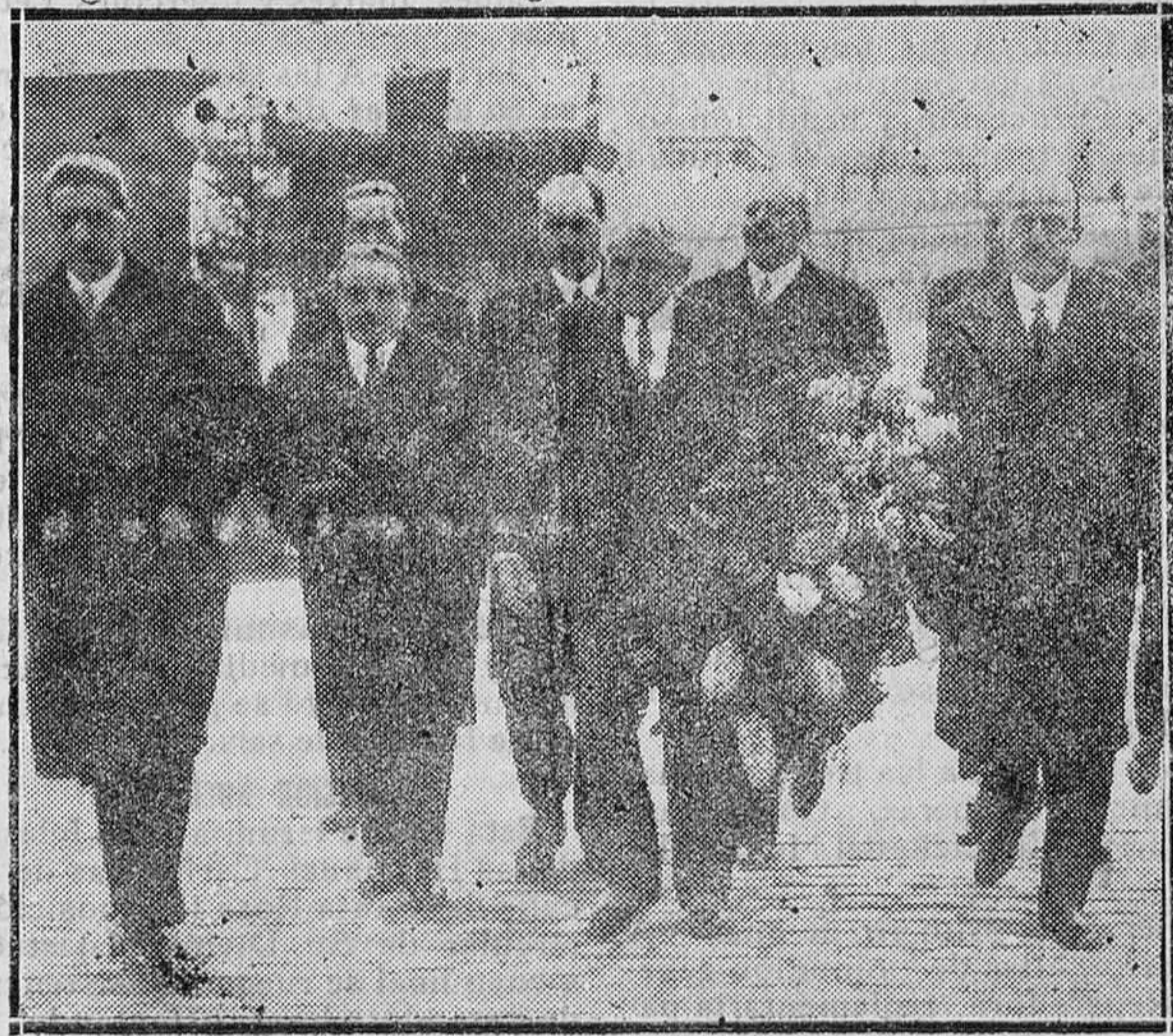
Mister Kellog, antiguo Secretario de Estados Unidos, promotor, con M. Briand, de Pacto de fuera de la ley de la guerra, llegado recientemente a París, llevando una gran corona de flores a la tumba del célebre político francés

En aquel tiempo, dijo Jesús a sus discípulos: En verdad, en verdad os digo: que os concederá el Padre celestial todo lo que le pidieréis en mi nombre. Hasta ahora no habéis pedido nada en mi nombre. Pedid y recibiréis para que vuestro gozo sea cumplido. Estas cosas os he dicho en parábolas: Llega la hora en que ya no os hablaré por parábolas: sino que os anunciaré claramente las cosas de mi Padre. En aquel día pediréis en mi nombre; y no os digo que rogaré al Padre por vosotros; por