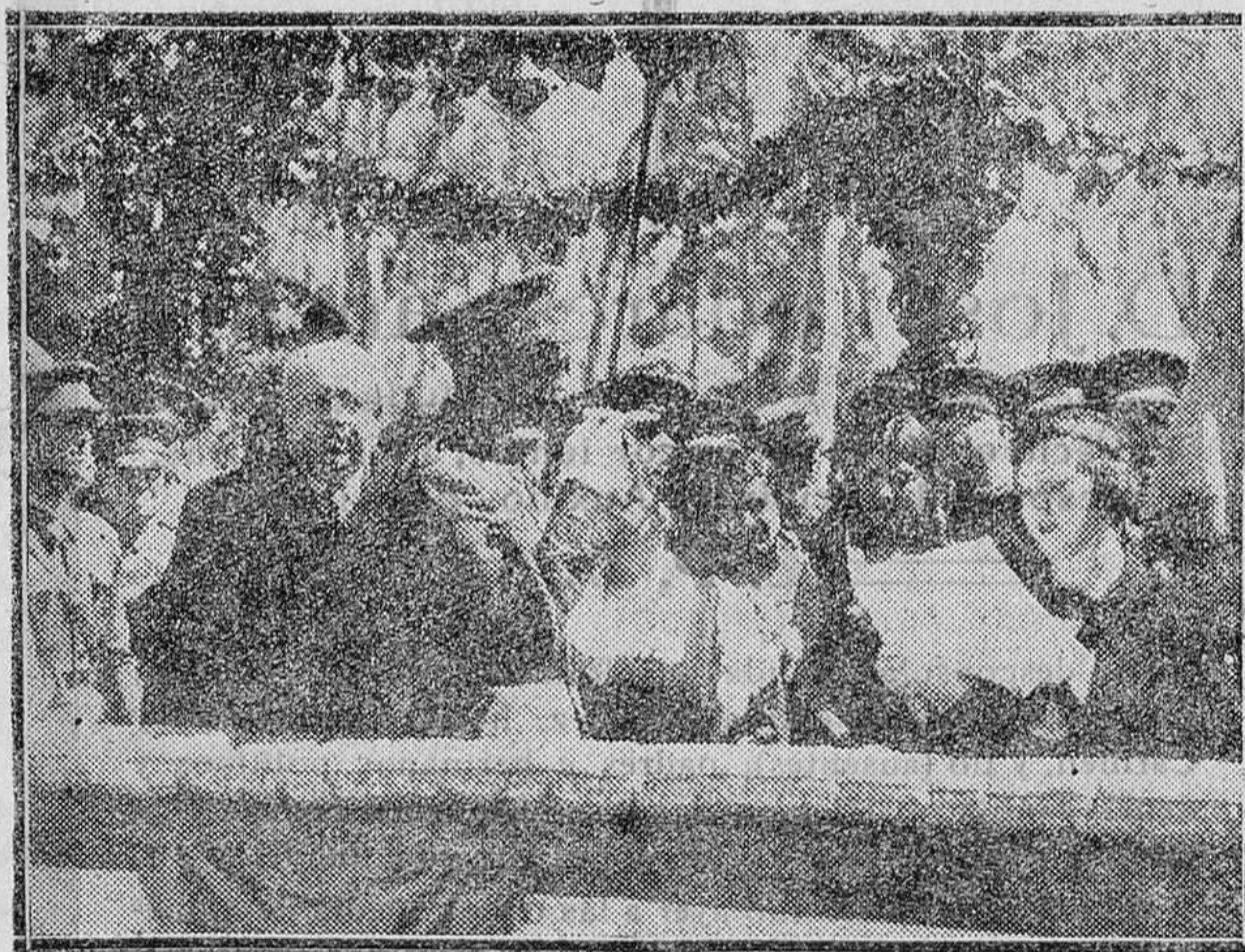
La señora del Presidente del Consejo, don Manuel Azaña, leyendo unas cuartillas en la entrega de la bandera al nuevo batallón de zmetralladoras-cañones en Aranjuez.

¡Tríplico deslumbrante de mágicas palabras! Igualdad, Libertad, Fraternalidad, divinas palabras que solo el Divino puede hacer reales, por el cultivo del bien, del amor y de la justicia que solo se alcanzan en aquel Dios y Señor que ahora se empeñan en desterrar de nuestras almas.