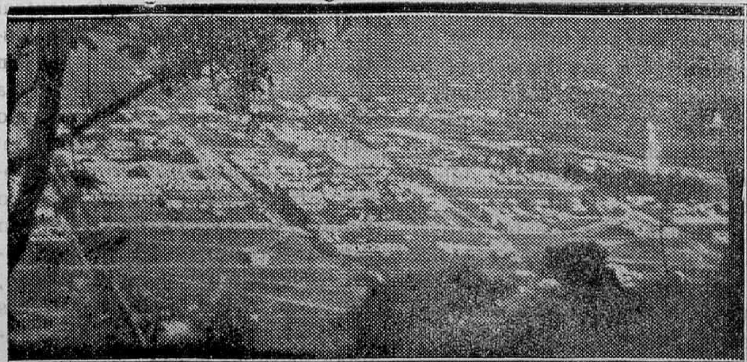
SALTA (Buenos Aires). — Una de las ciudades de América que a consecuencia de la lluvia de ceniza quedó completamente inundada y casi incomunicada con el resto de las provincias.