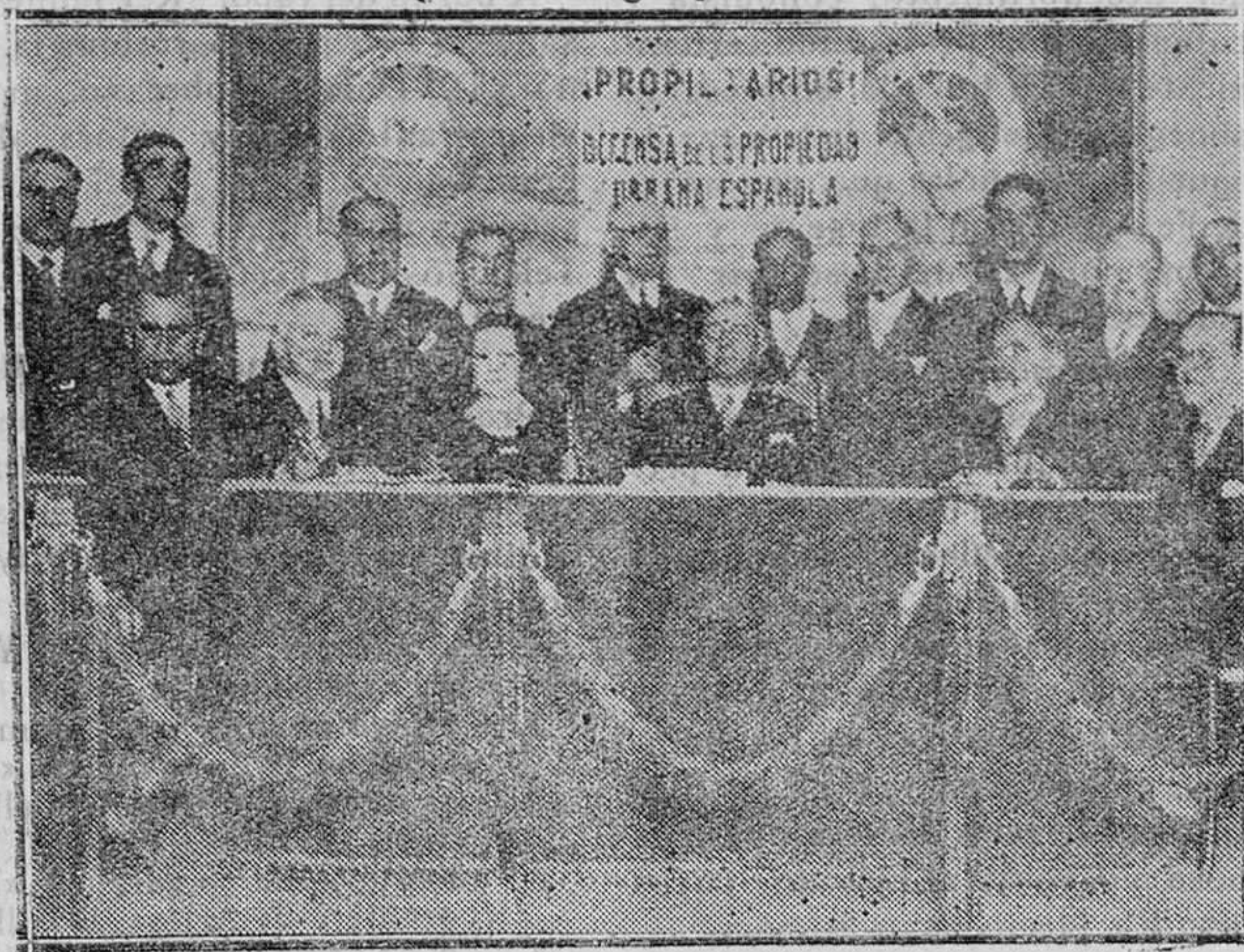
DEFENSA A LA PROPIEDAD URBANA ESPAÑOLA. La Mesa presidencial del acto de afirmación social, celebrado en la Sociedad «La Unión»