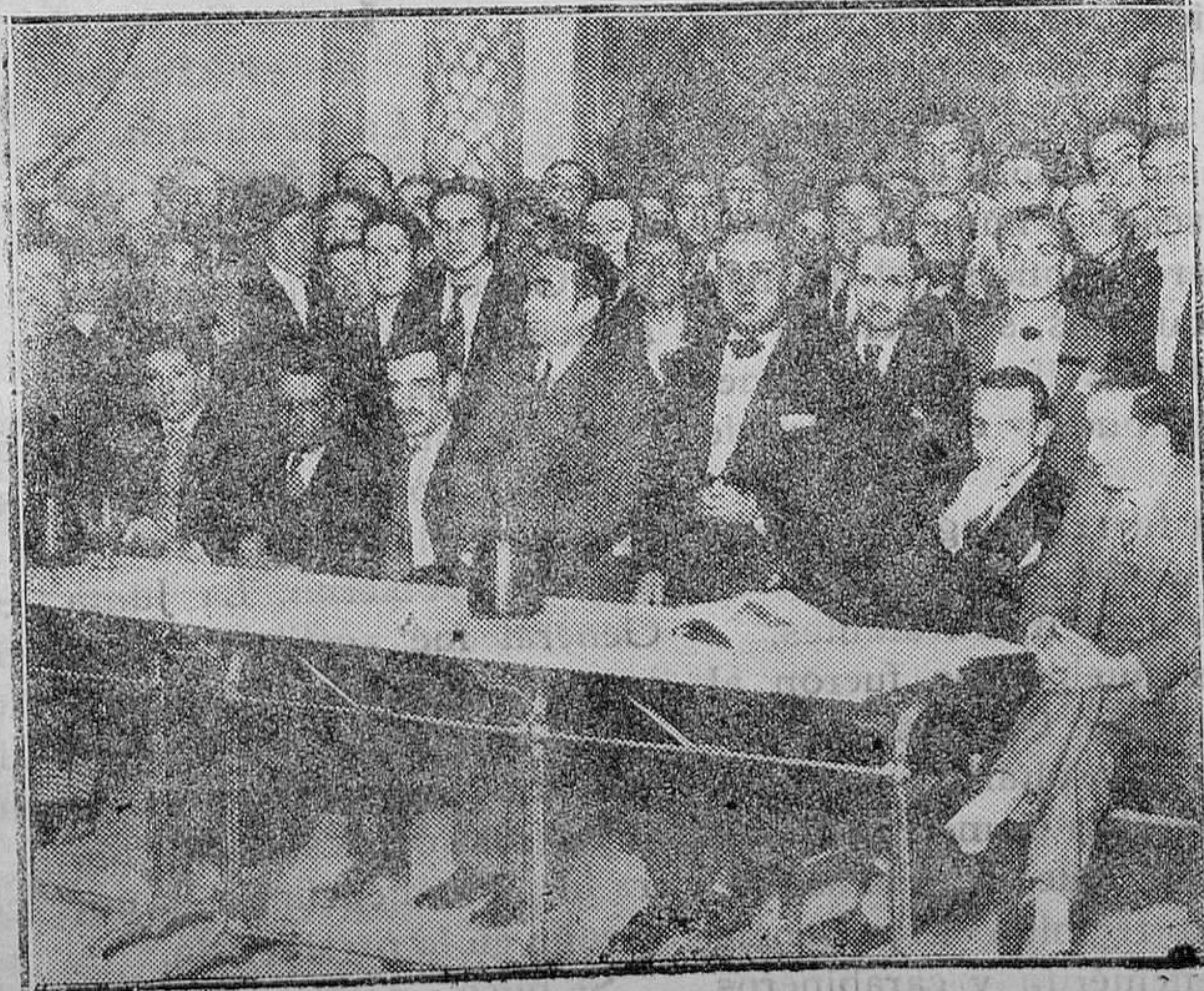
MADRID.—La presidencia del Sindicato de la Alimentación en huelga, reunidos en el teatro Ideal Rosales

El señor Lerroux en su discurso de Valencia ha declarado que gobernará con un libro y que ese libro es la Constitución. ¡Ya es hora de que los españoles puedan leer en las páginas de ese libro que permanece cerrado desde su edición. ¿Para qué servirá el libro? No revelamos el misterio; pero el señor Lerroux ha afirmado que guarda la