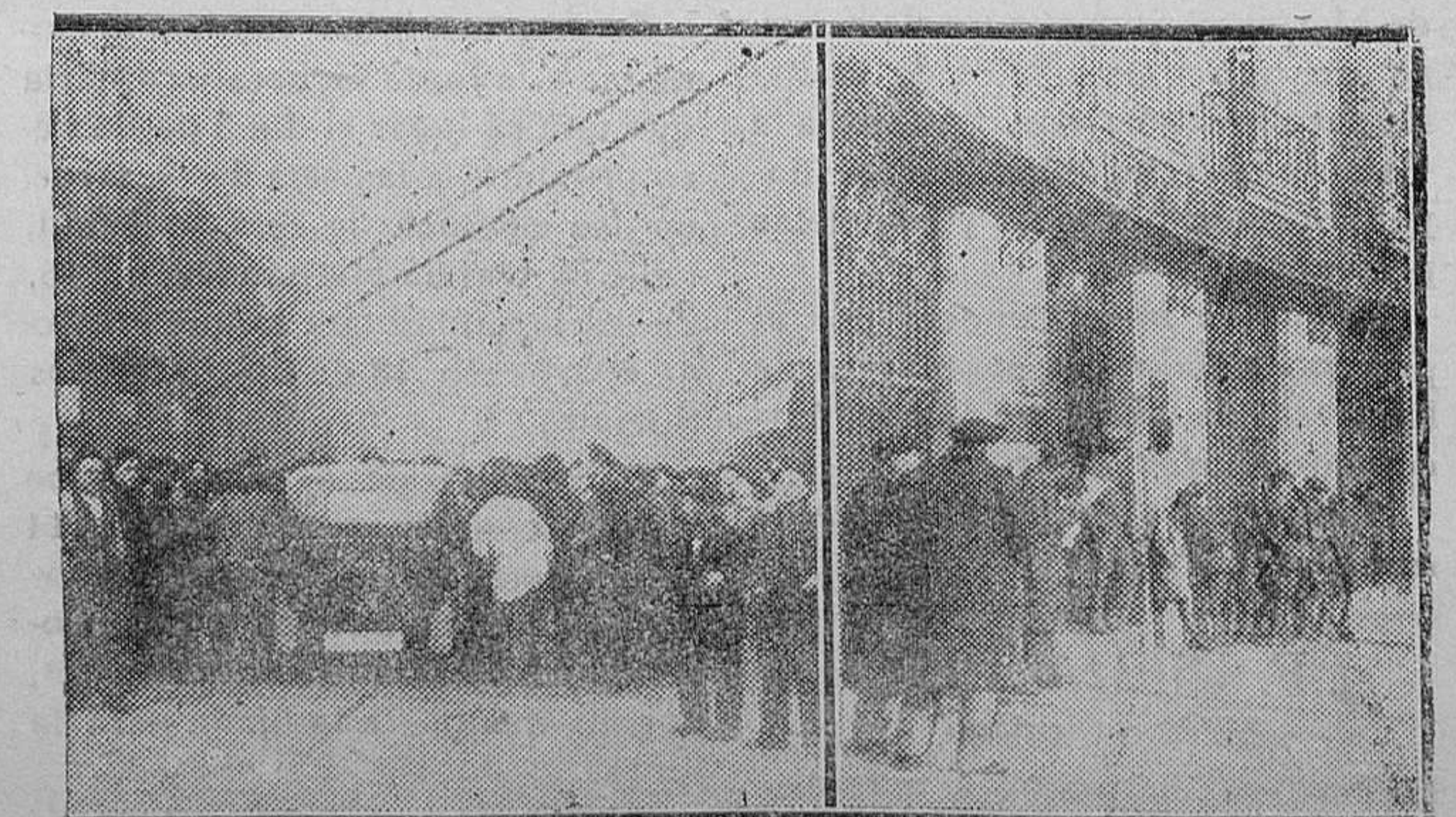
BILBAO — Grupo de obreros deteniendo a los automóviles para comprobar si pertenecían al servicio médico. Fuerzas de la guarnición vigilando el local del Banco del Río de la Plata