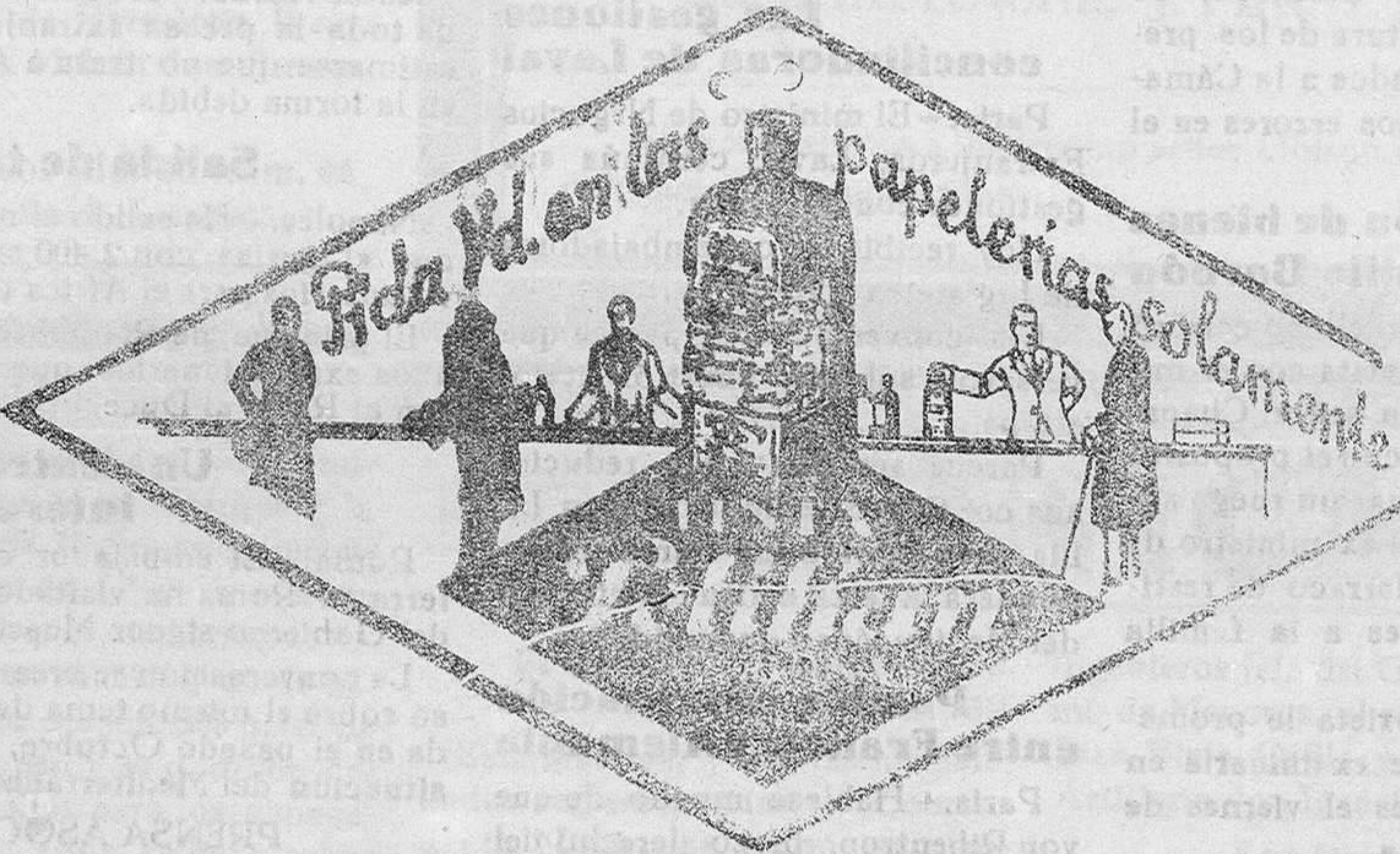
De venta en la Librería de MANUEL SINTES ROTGER, Plaza de Pablo Iglesias, 17, Mahón

NO OLVIDE USTED QUE SON 4 los tomos que forman un ejemplar del