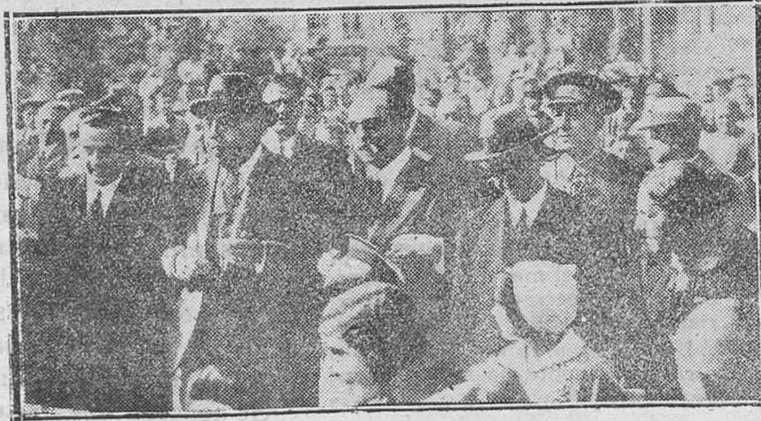
MONTSERRAT. — Visita del Jefe del Gobierno al Monasterio. — El Jefe del Gobierno, acompañado del ministro de la Gobernación señor Casares Quiroga y del gobernador civil de la capital catalana señor Moles, a su llegada al Monasterio de Montserrat