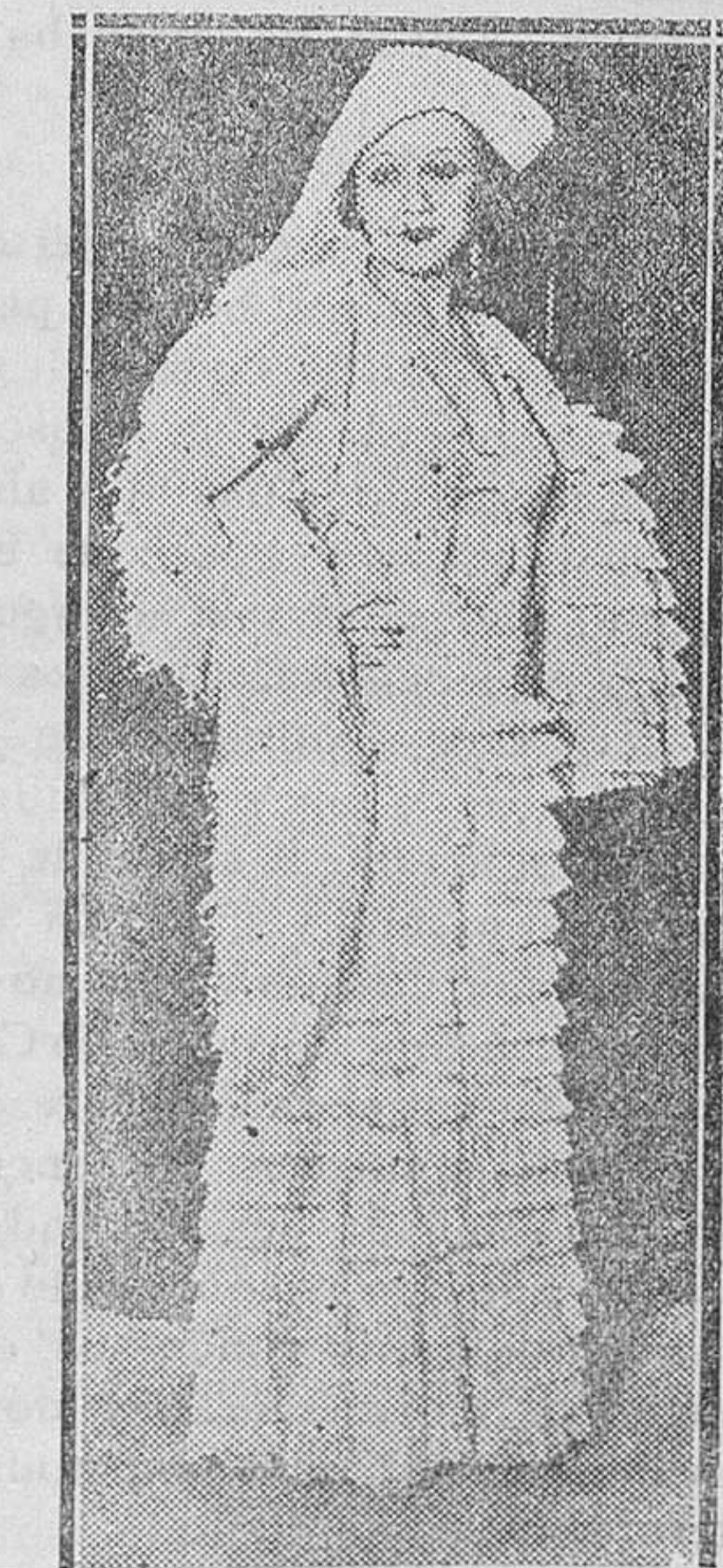
La gentil y bella artista Anita Lasalle, que ha obtenido un gran éxito en el teatro de la Comedia con el estreno de «Contigo a solas»