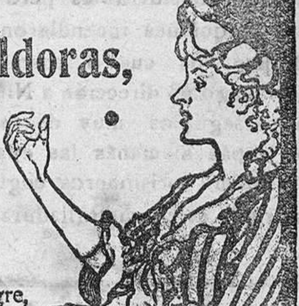
Aunque el grabado a los ojos y verá Vd. la píldora entrar en la boca.

DE VENTA EN LAS BOTICAS DEL MUNDO ENTERO.