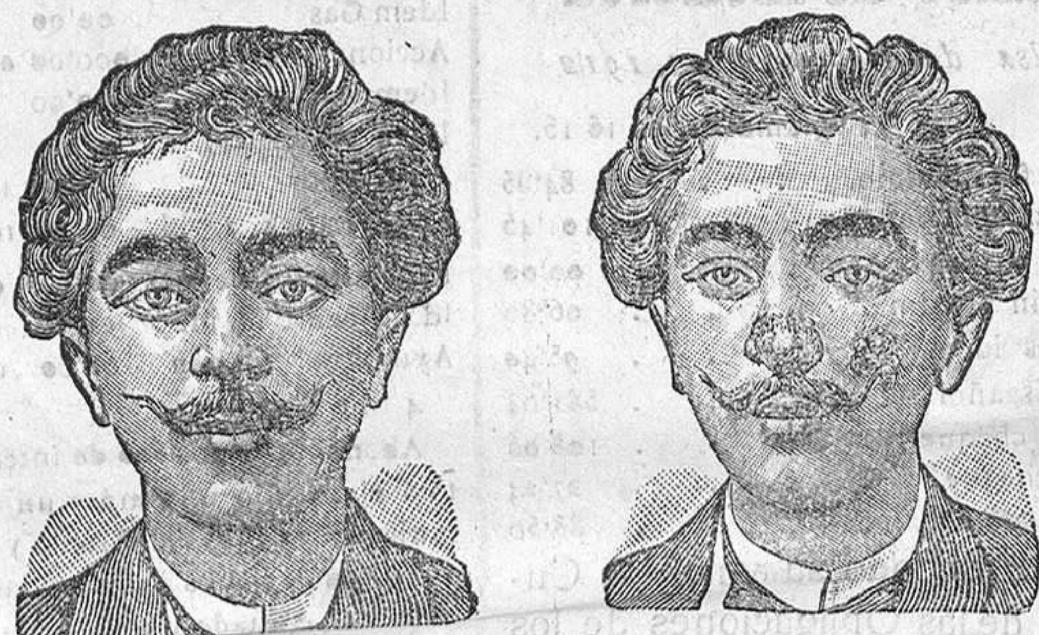
Antes de la curacion