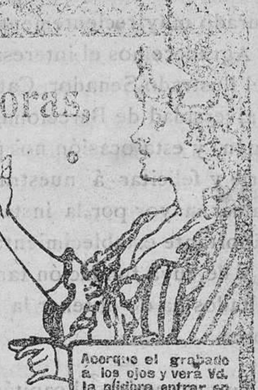
Acorgue el grabado á los ojos y verá Vd. la píldora entrar en la boca.

DE VENTA EN LAS BOTICAS DEL MUNDO ENTERO. 40 Píldoras en Caja.