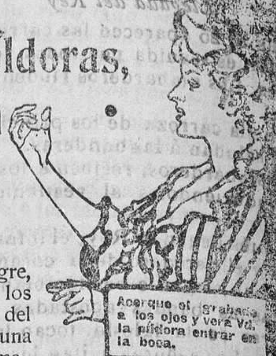
Acerque el grabado á los ojos y verá Vd. la píldora entrar en la boca.

DE VENTA EN LAS BOTICAS DEL MUNDO ENTERO. 40 Píldoras en Caja.