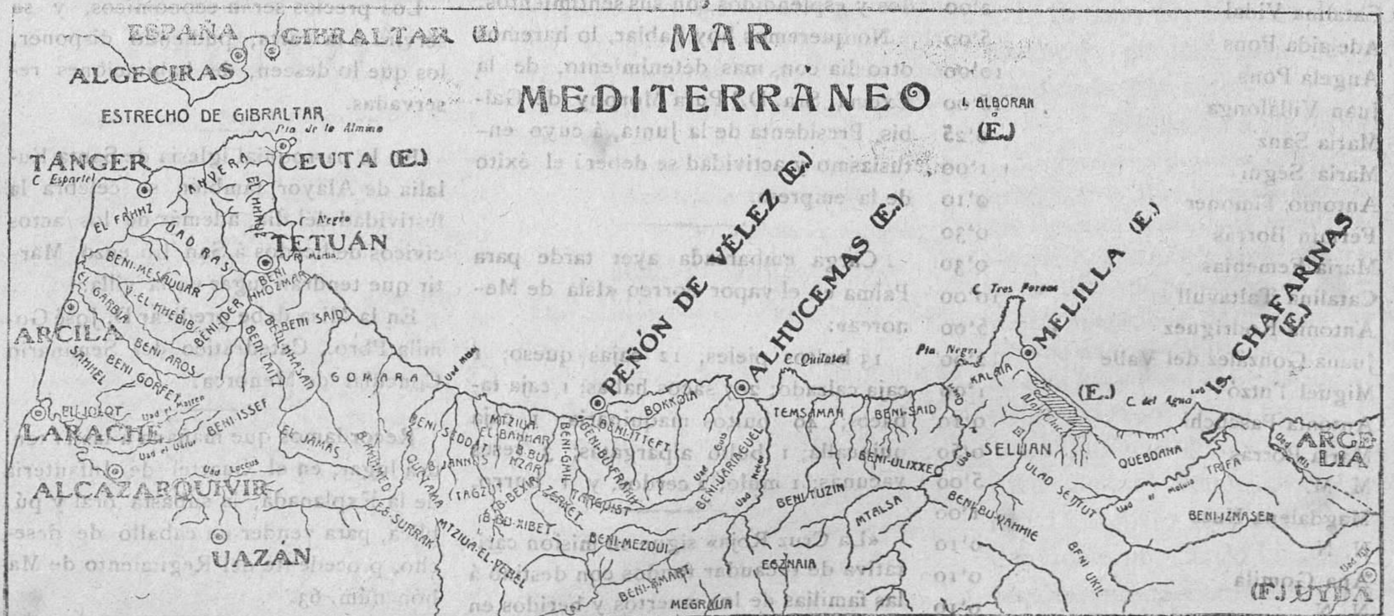
LAS LETRAS I, F, E., DESIGNAN RESPECTIVAMENTE LAS POSICIONES INGLESAS, FRANCESAS Ó ESPAÑOLAS.

«Excmo. Sr. Teniente General don Arsenio Linares Pombo.—Mi respetable General.—Asuntos patrióticos, ánimo y espíritu militar me obliga, Excmo. Sr., á dirigirme á V. E. para manifestarle, que me he presentado en el Gobierno Militar de esta plaza suplicando se me diera curso á una instancia, solicitando el pase con el actual empleo de 2.º Teniente de la reserva gratuita con destino á uno de los Regimientos que se hallan al frente del enemigo en Melilla; en dicho Gobierno con muy buenos deseos de dar curso á la instancia se me hace presente que no pueden