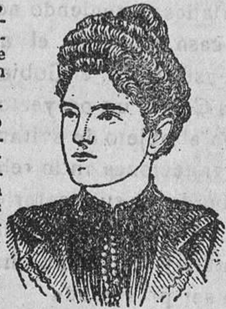
DOLORES DEL RÍO.

Un frasco de prueba será enviado á quien lo pida á D. Carlos Marés, calle de Valencia, 333, Barcelona, acompañando 75 céntimos en sellos de correo para franquear.