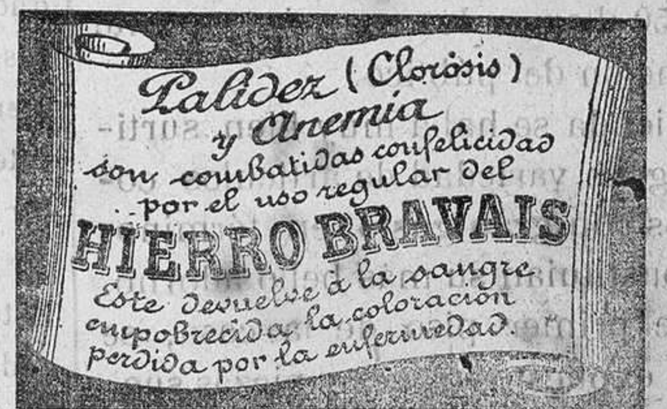
Depósito en todas las principales farmacias