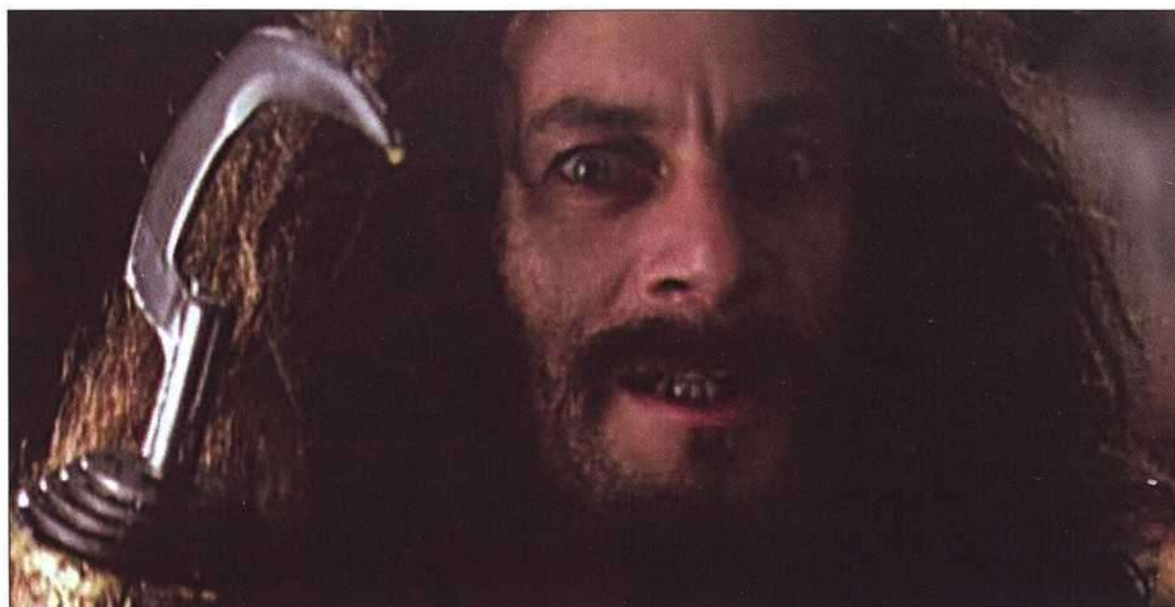
Imagen de Peter Pan, la gran aventura, en la que Jason Isaacs interpreta a Mr. Darling y al Capitán Garfio.

Al lado, el Peter Pan de Disney, un film que marcó para siempre las siguientes adaptaciones de la obra de J. M. Barrie.