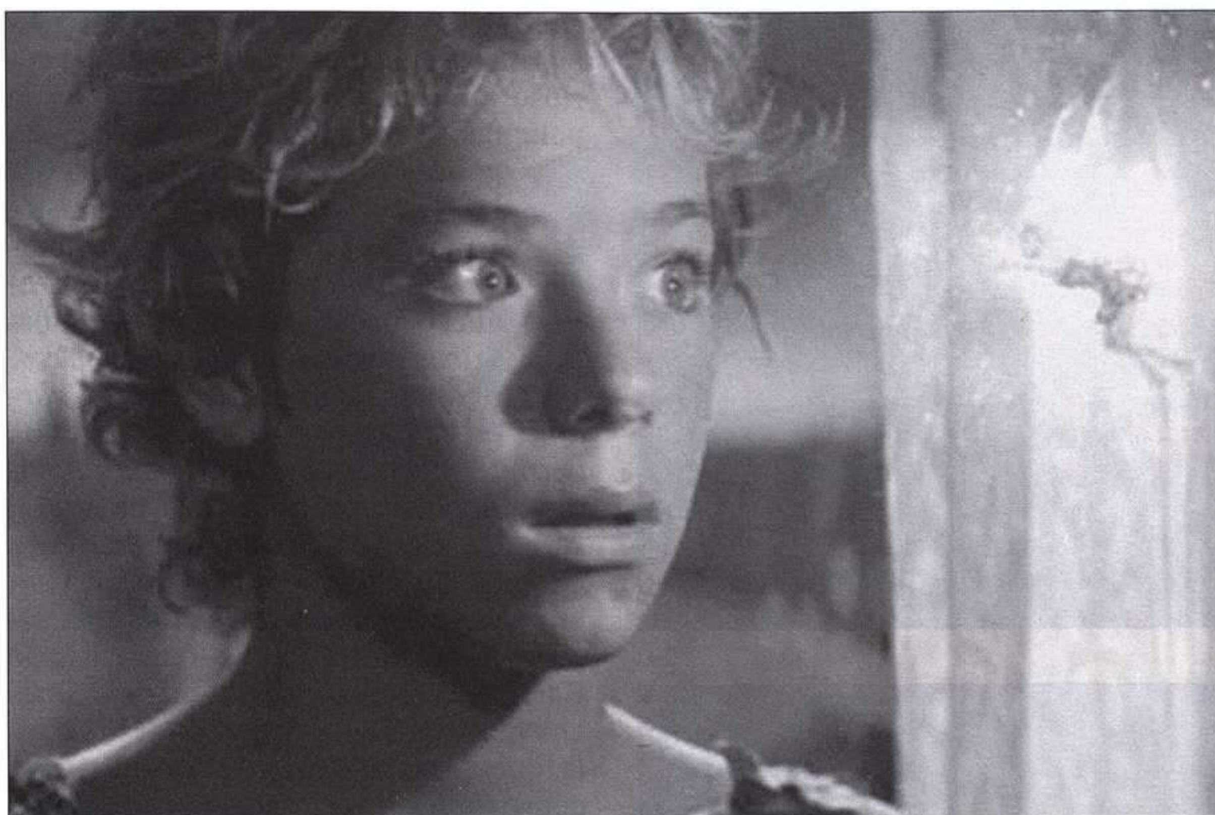
Jeremy Sumpter encarna a Peter Pan en la película de P. J. Hogan, la más fiel adaptación de la obra de Barrie hasta el momento.