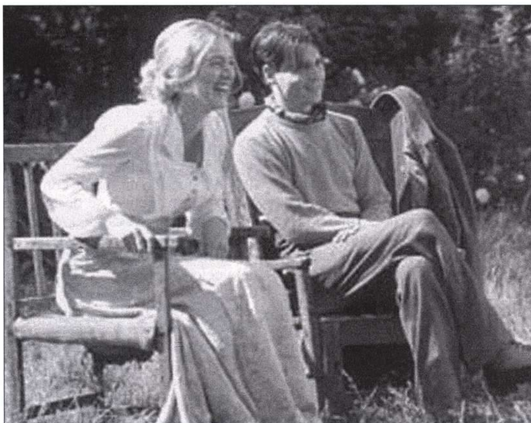
Johnny Deep y Kate Winslet en el rodaje de Finding Neverland . Ella interpreta a Sylvia Llewelyn Davies, la madre de los niños que Barrie adoptó a la muerte de sus padres.

Pero como la fidelidad no es garantía de calidad, ni mucho menos, al film de Hogan le falta vitalidad, quedando demasiado encorsetado entre su referente literario y las férreas exigencias de la productora. Y es que pedir fidelidad al original se antoja en este caso aún más incongruente que de costumbre, si se tienen en cuenta las numerosas modificaciones que el propio Barrie introducía en cada nueva representación. En sínte-