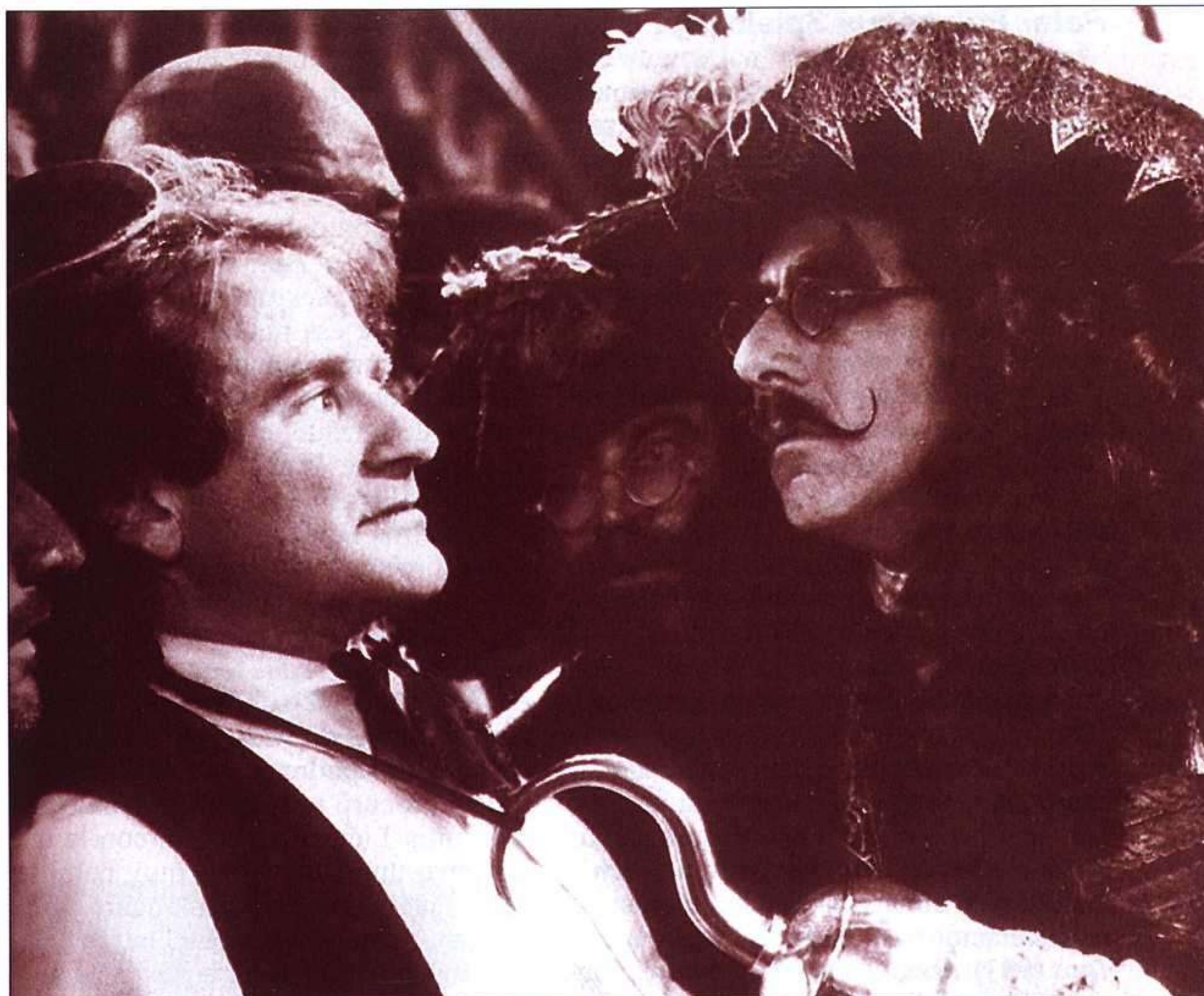
Robin Williams interpreta a Peter Banning, un hombre de negocios actual que no recuerda su vida pasada como Peter Pan. Dustin Hoffman es el capitán Garfio en este film de Spielberg, Hook (1991).