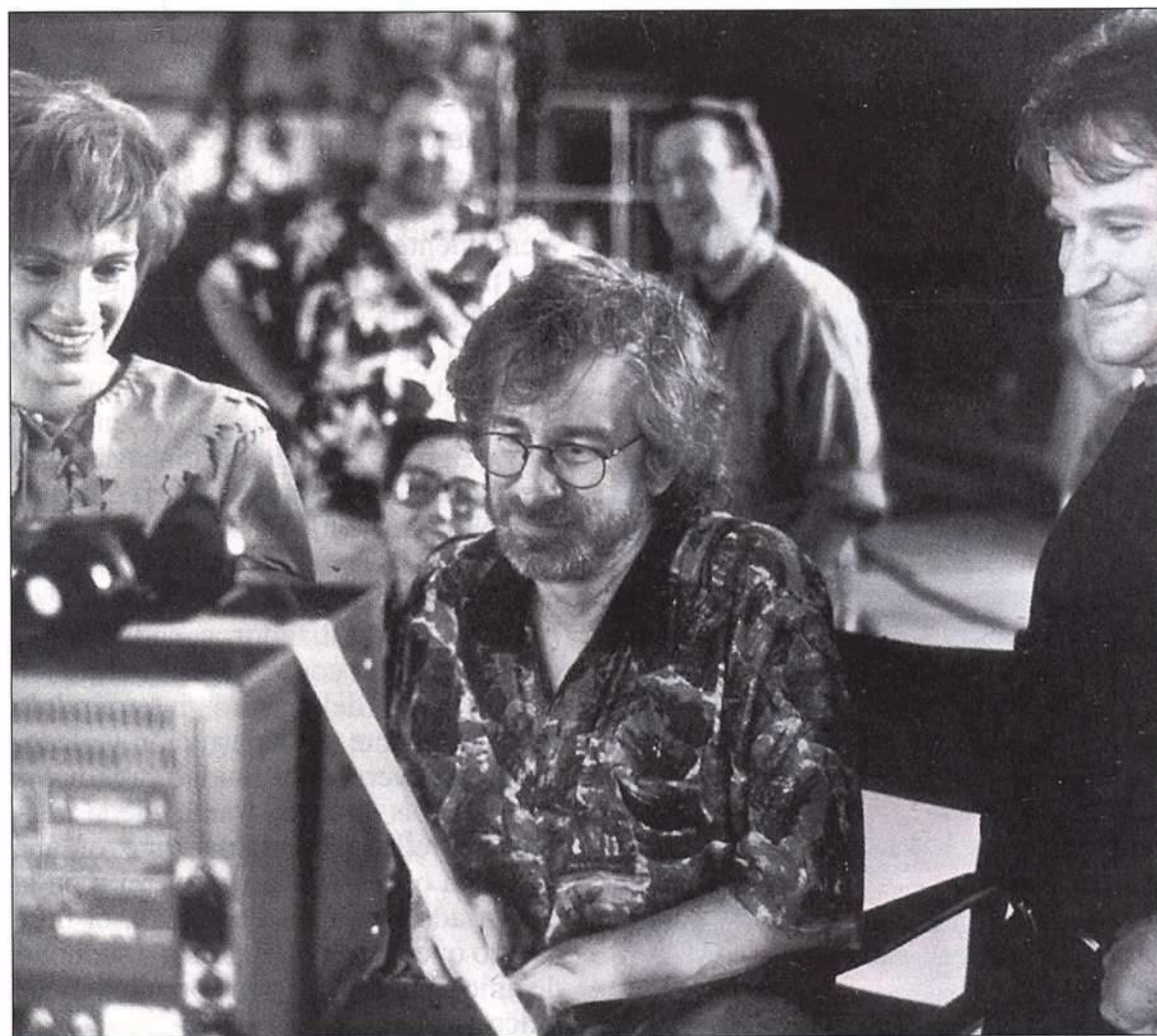
Spielberg, sentado, junto a Julia Roberts (Campanilla) y Robin Williams (Peter Pan) revisando las escenas rodadas de Hook.

sis, el más reciente de los Peter Pan cinematográficos se mueve entre las buenas intenciones y una atonía narrativa que frustra su desarrollo.