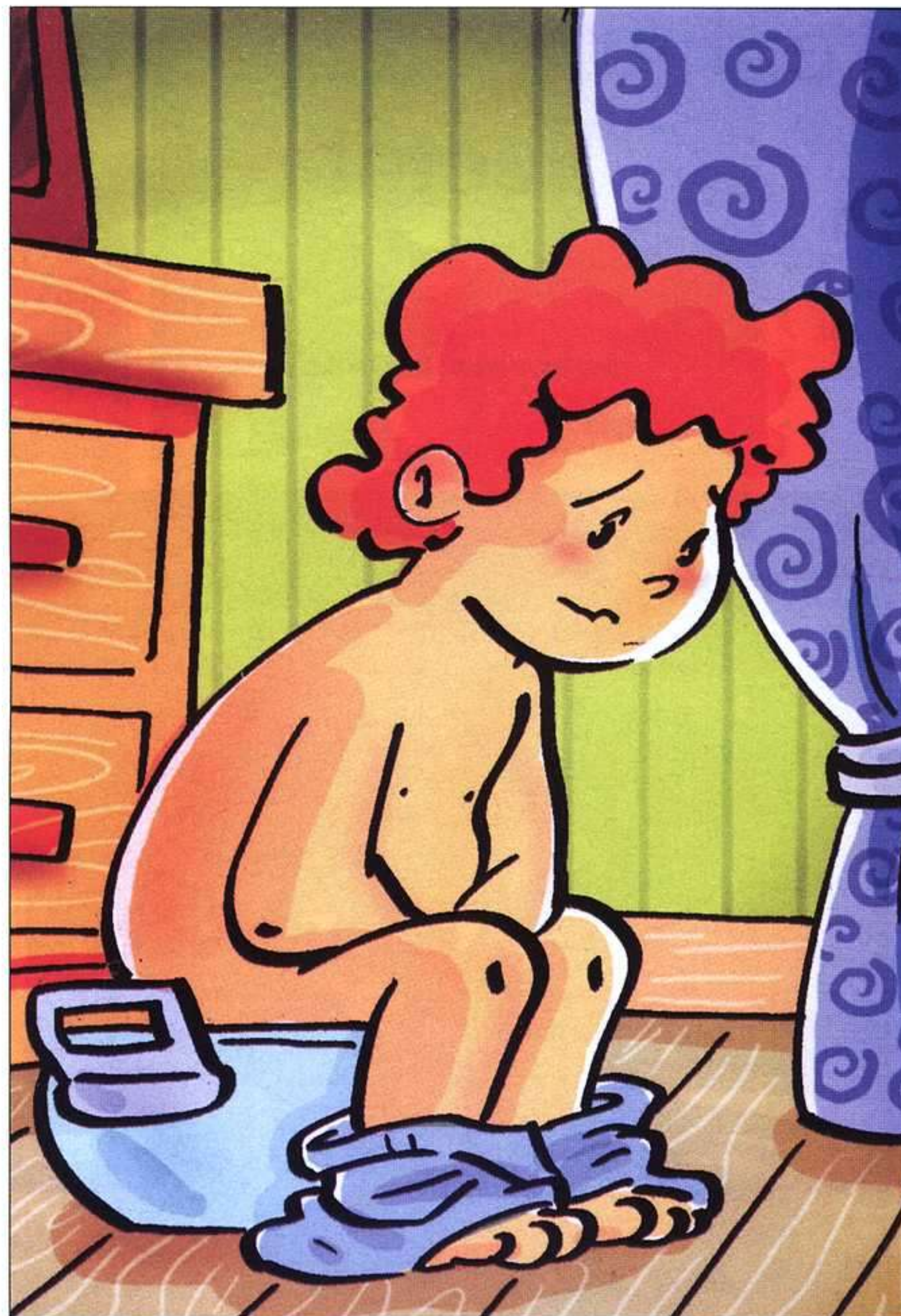
ENRIQUE CARBALLEIRA, ¿PA QUÉ VAL UNA POTÁ?, ASTURTOONS, 2006.

No lliterario, el protagonismu animal encuadráu nun esquema narrativu popular sigue presente nes Dos histories d'animales (Madú, 2007) d'Helena Trejo Fombella, cola interpretación visual de Violeta Sánchez Trejo. Pero pa quien se sal del ámbitu domésticu y s'atreve yá a adien-