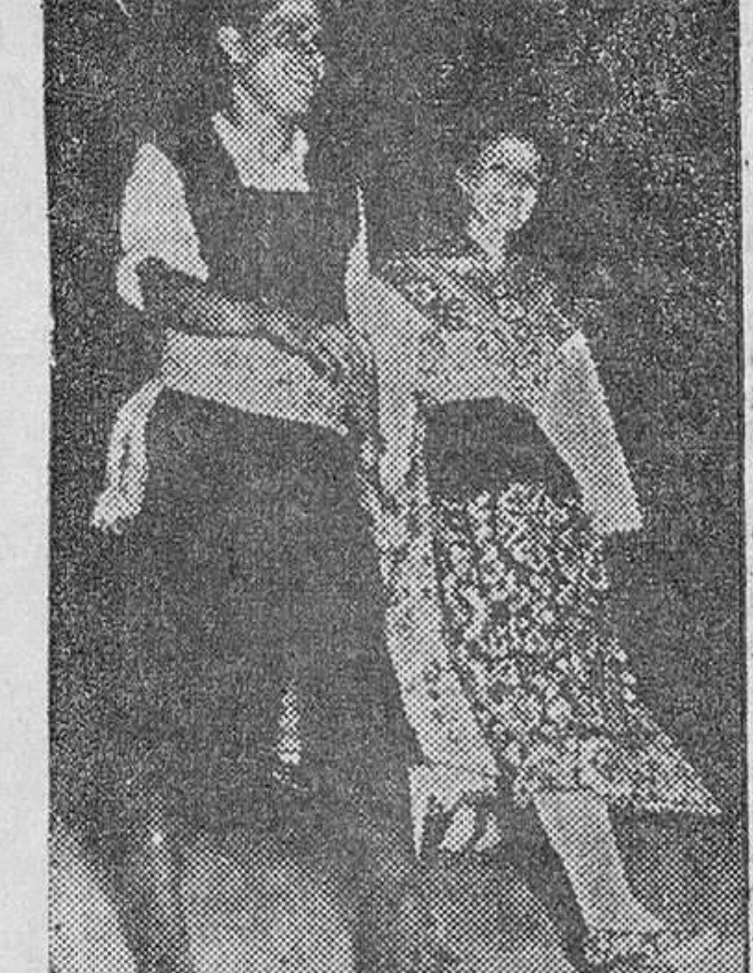
Parejas del Grupo de Danzas de Benavente durante la actuación que les valió el Primer Premio en Ponterrada.