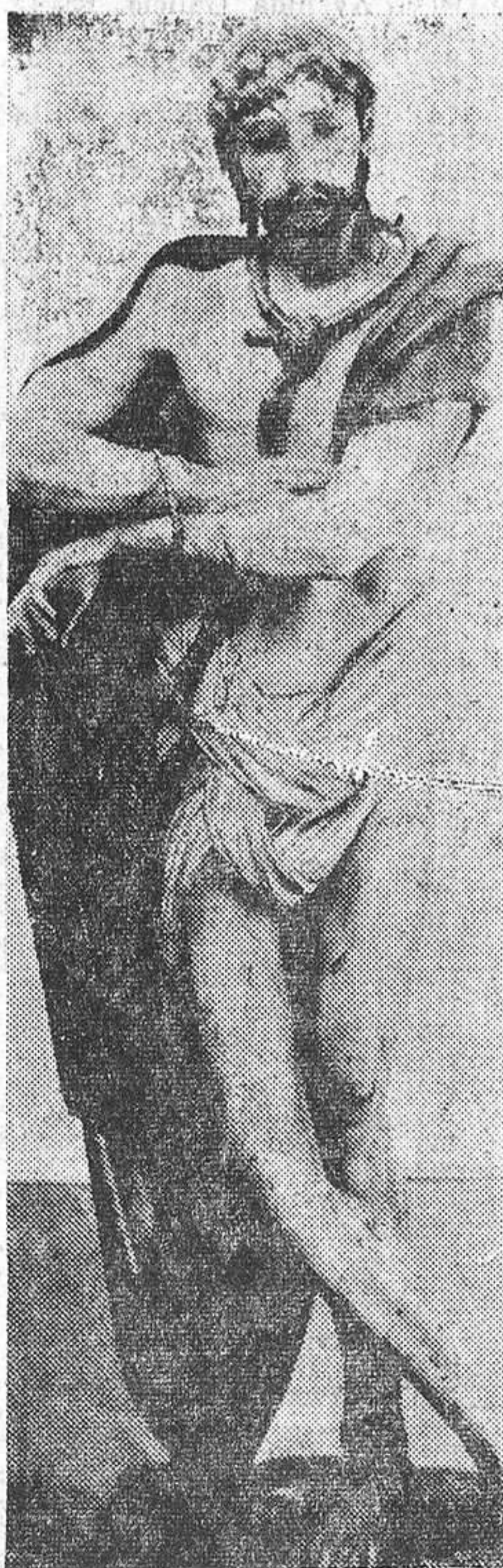
«Ecces-Homo», sorprendente imagen del retablo de Olmedo, centro del retablo que ahora, sin culto, debería pensarse el traslado al Museo Nacional de Escultura e incluso que sirviera para ceremonias religiosas y para el sacrificio inconcruente de la misa.

de incongruencias; y que sin la maestría pictórica de unas manos certeras no serían ponderadas imágenes deslumbrantes, cuajadas de ideales en esta