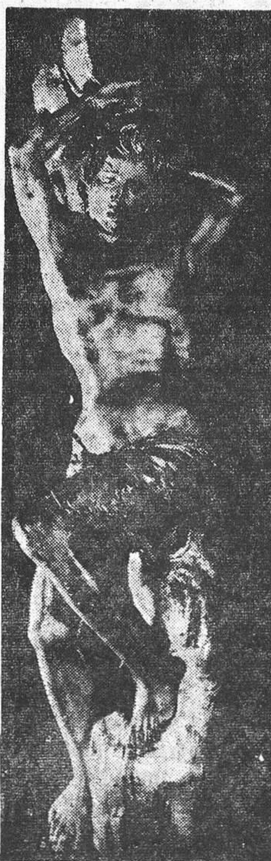
«San Sebastián», talla triunfal del arte berruguetesco procedente del convento de San Benito.

En estos días se llega a escribir que gracias a la pintura salvó muchas obras salpicadas