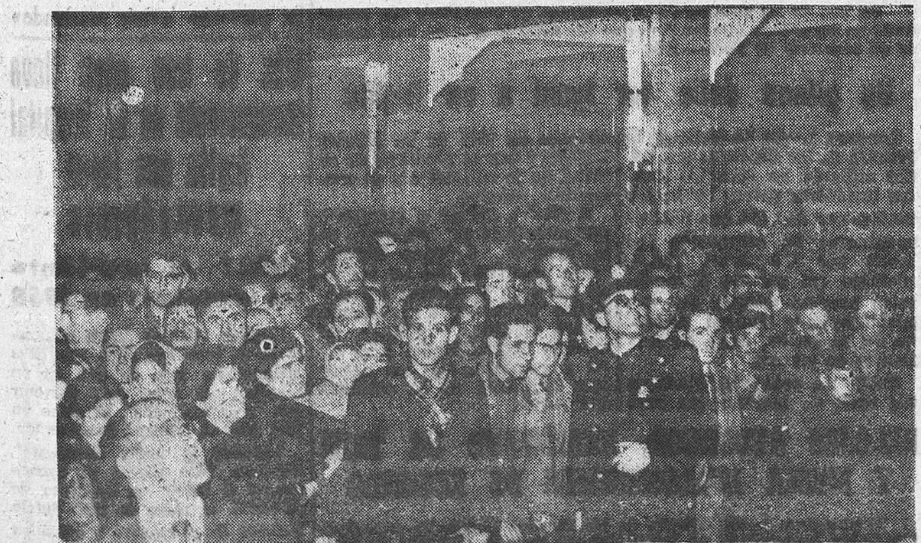
El vestíbulo principal de la Delegación Provincial de Sindicatos, así como los espacios reservados a las oficinas y los pasillos superiores, se abarrotaron de público, calculándose en más de mil los peticionarios que acudieron a presenciar el sorteo.