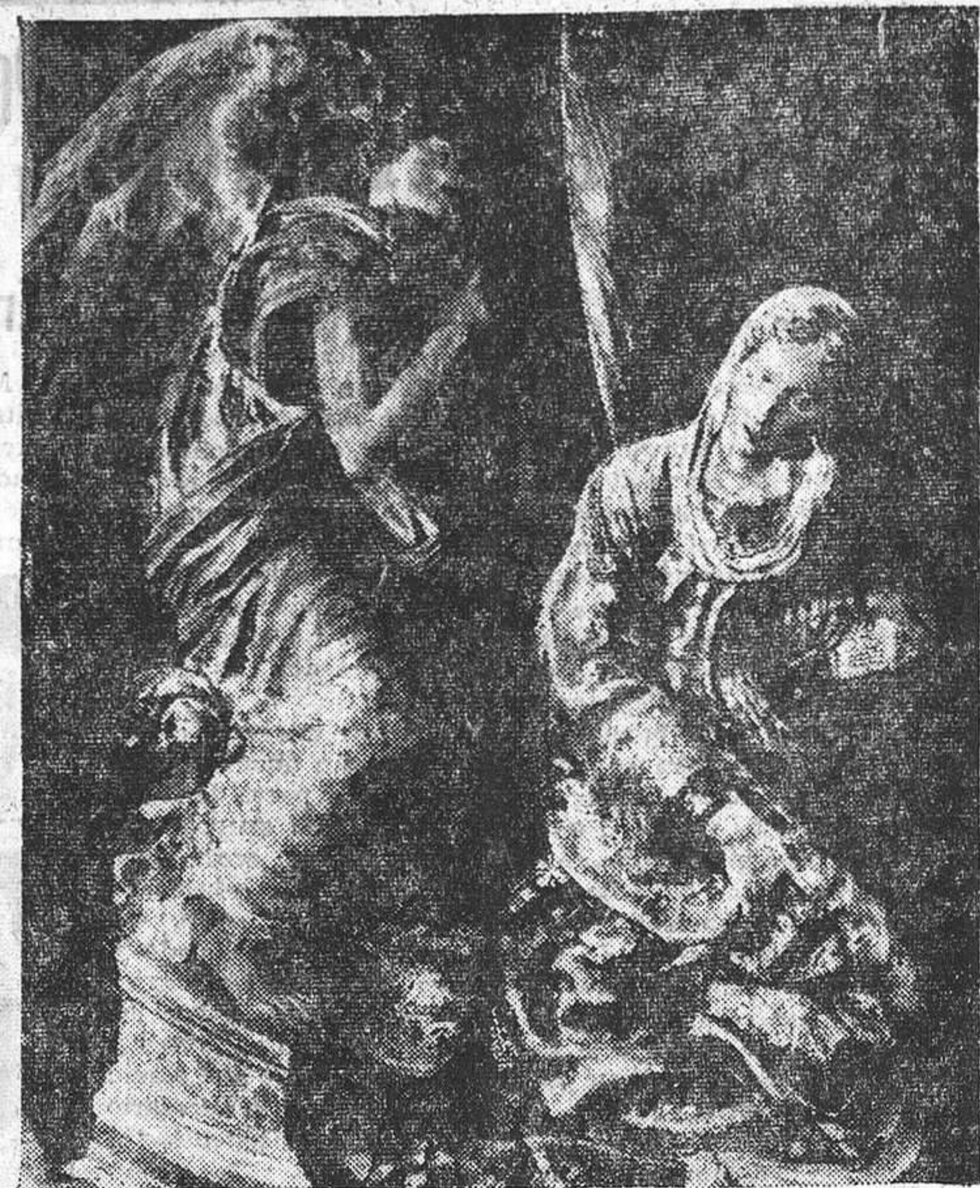
«La Anunciación», de Berruguete, inspirada en la de Donatello, en Santa Croce, de Florencia.

voluntades de gente que vivía con los ojos abiertos. Aparecen después memoriales elevados al Rey en los que se compromete Alonso a pintar—no a tallar, ni esculpir—muchas historias que cada vez van siendo menos a medida que se avanza la permanencia en Granada. La intervención de Bigarny es indudable, como la de Berruguete. Este mismo declara que hizo el cartón del Diluvio para la sacristía de la capilla y el del Descendimiento para el altar mayor, a que se refería en el primer proyecto de contrato, dentro de un copioso encargo de quince frescos. En el tercer memorial elevado al Emperador se queja Berruguete de los gastos hechos desde Sevilla. El Rey no hace caso a ninguno de los escritos y ello aburría al artista. Todo esto parece que sucede en el transcurso de 1521, y una parte de ello es segura en el citado año.