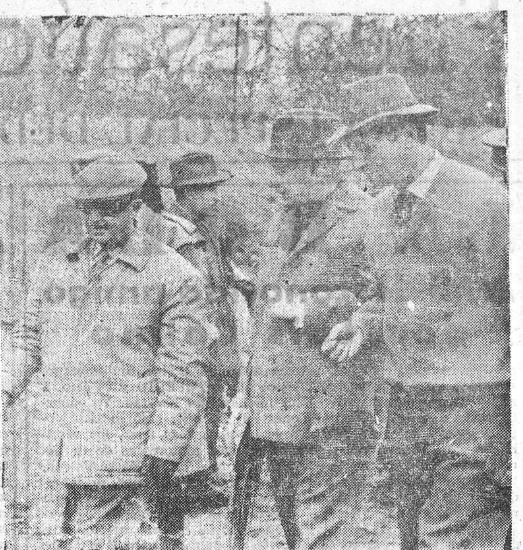
Los Jefes de Estado de España y Portugal, durante el viaje de este último a nuestro país, conversan animadamente en el curso de la cacería que tuvo lugar en Aranjuez. Les acompaña el marqués de Villaverde.