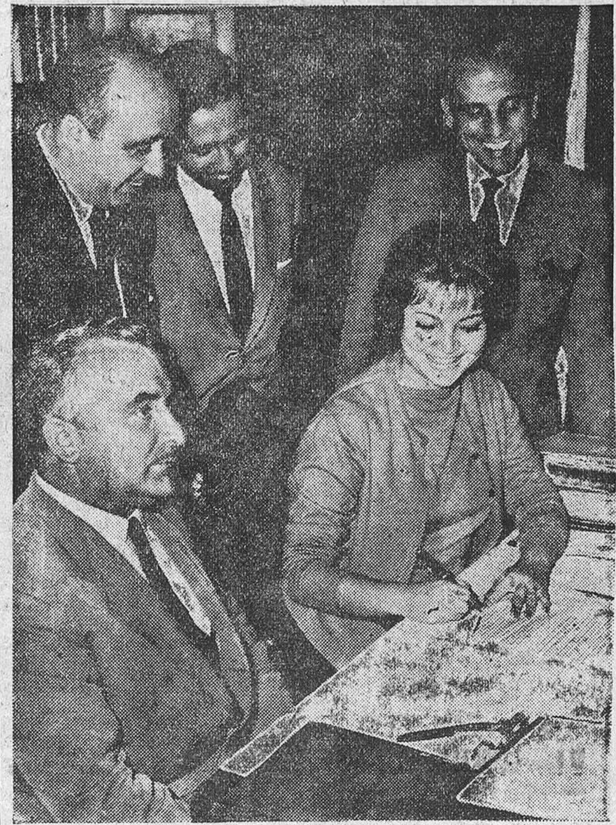
Momento de la firma por Sarita Montiel del contrato para su primera actuación personal por Radio y TVE. "Mejores no hay".