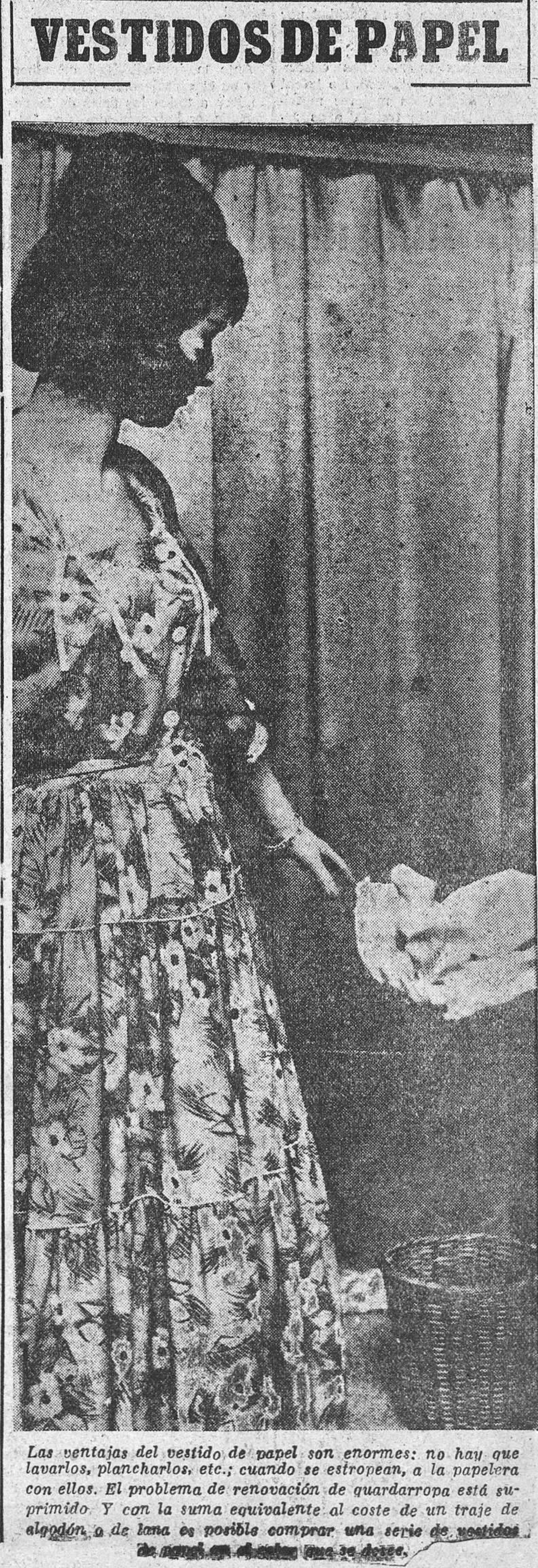
Las ventajas del vestido de papel son enormes: no hay que lavarlos, plancharlos, etc., cuando se estropean, a la papelera con ellos. El problema de renovación de guardarropa está suprimido. Y con la suma equivalente al coste de un traje de algodón, a de lana es posible comprar una serie de vestidos...