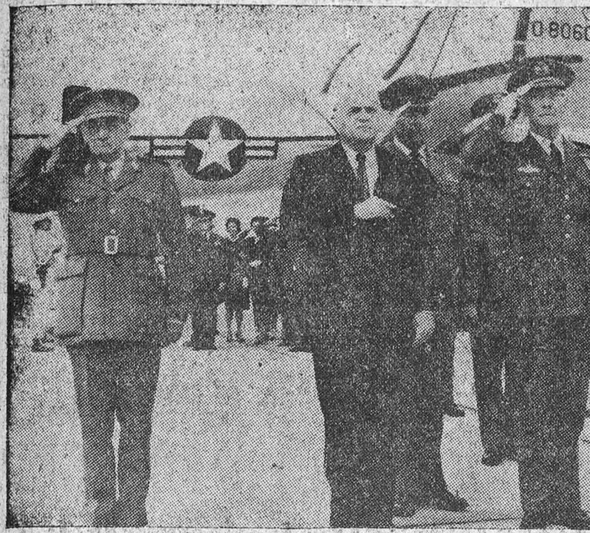
TORREJON DE ARDOZ.—El secretario de las Fuerzas Aéreas de los Estados Unidos, Eugene Zuckert, llegó a la Base Aérea de Torrejón a mediodía del jueves y fue recibido por el ministro del Aire, teniente general Rodríguez y Díaz de Lecea; capitán general Muñoz Grandes y representantes del Ministerio del Aire, Fuerzas Americanas y Embajada de los Estados Unidos. En la foto, el secretario norteamericano con el Ministro español del Aire y personalidades, escuchan los himnos nacionales.

Washington, 6.—El ministro soviético de Asuntos Exteriores, Andrei Gromyko, ha llegado a esta capital, procedente de Nueva York, para celebrar conversaciones en la Casa Blanca con el presidente Kennedy sobre la crisis de Berlín.