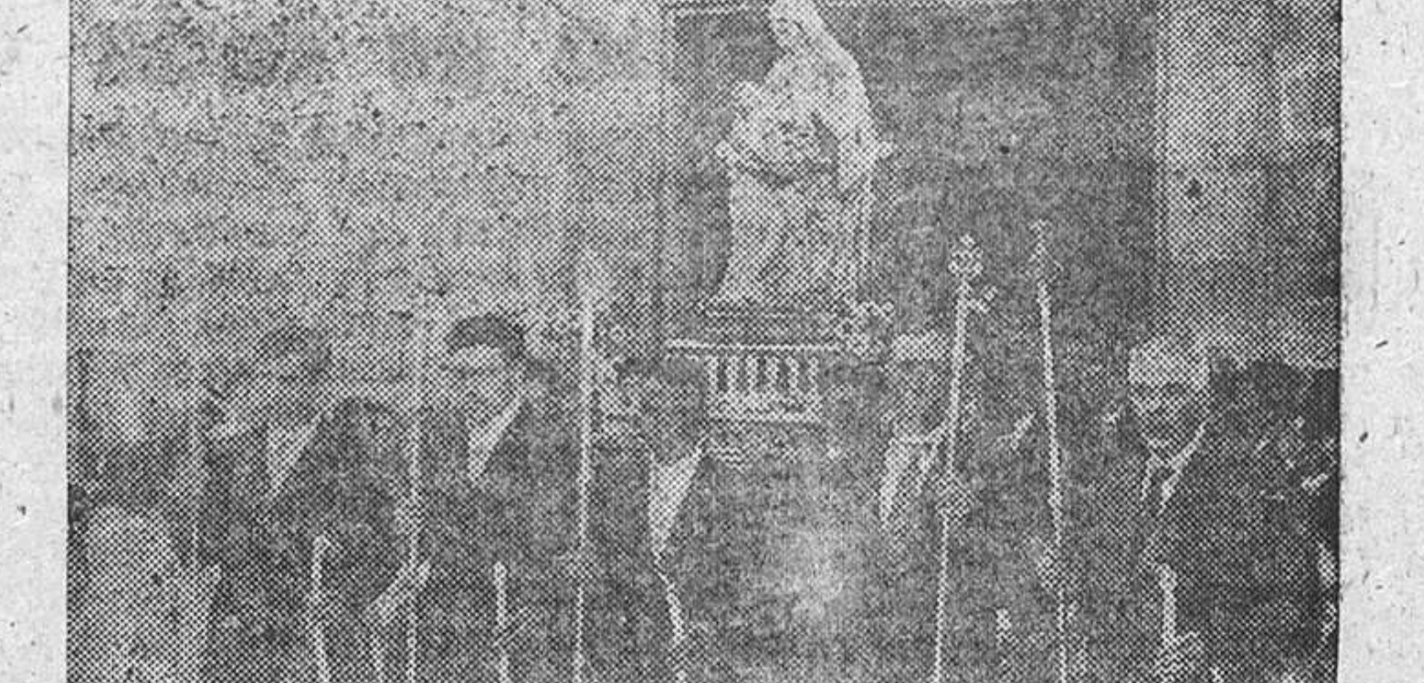
UN MOMENTO DE LA PROCESION.—Nuestra Madre la Virgen de la Bandera saliendo de su santuario camino de la Iglesia parroquial. Los mayordomos, muy ufanos, presidiendo la procesion de la Patrona de Fermoselle.

(Viene de segunda página) derrochado este año en honor de nuestra Madre la Virgen de la Bandera. Enhorabuena a los mayordomos y que podamos darles la enhorabuena cuando lleguen a ser jueces de esta Cofradía.