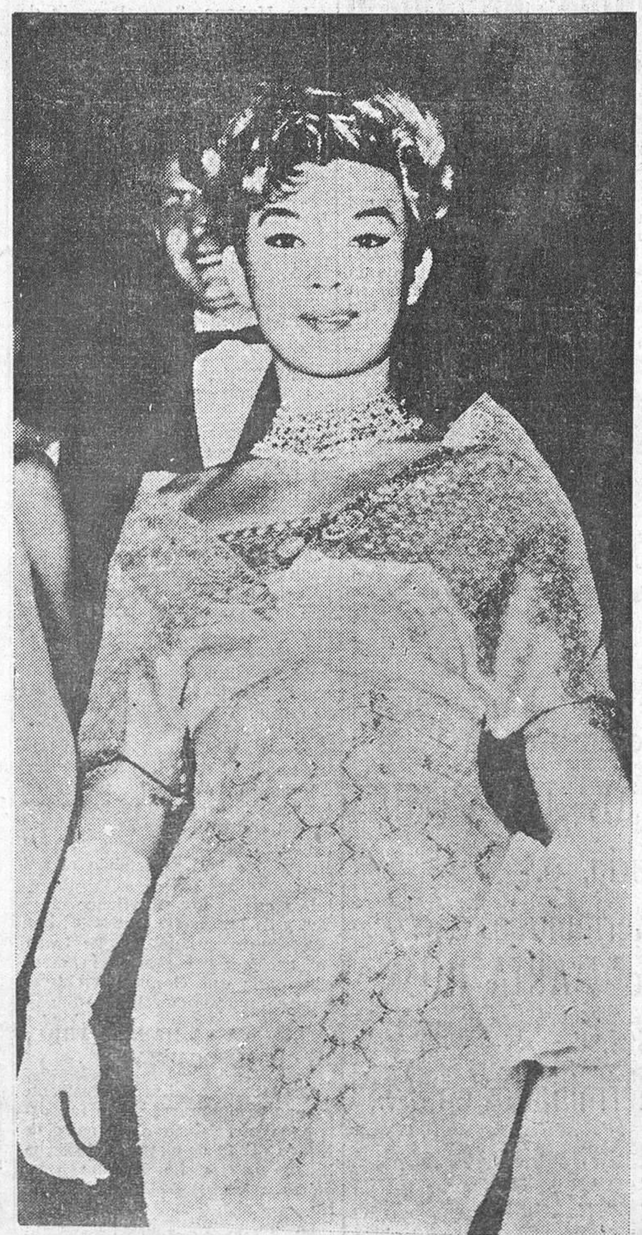
Yoko Tani, la famosa estrella nipona que está acaparando todas las producciones inglesas y francesas.

Ante la afluencia cada día más grande que está observándose en las producciones cinematográficas de mujeres japonesas, un productor alemán no ha tenido más remedio que llamar a la actual época del séptimo arte como "la de oro de la mujer japonesa". En Hollywood está de moda contratar actrices del Imperio del Sol