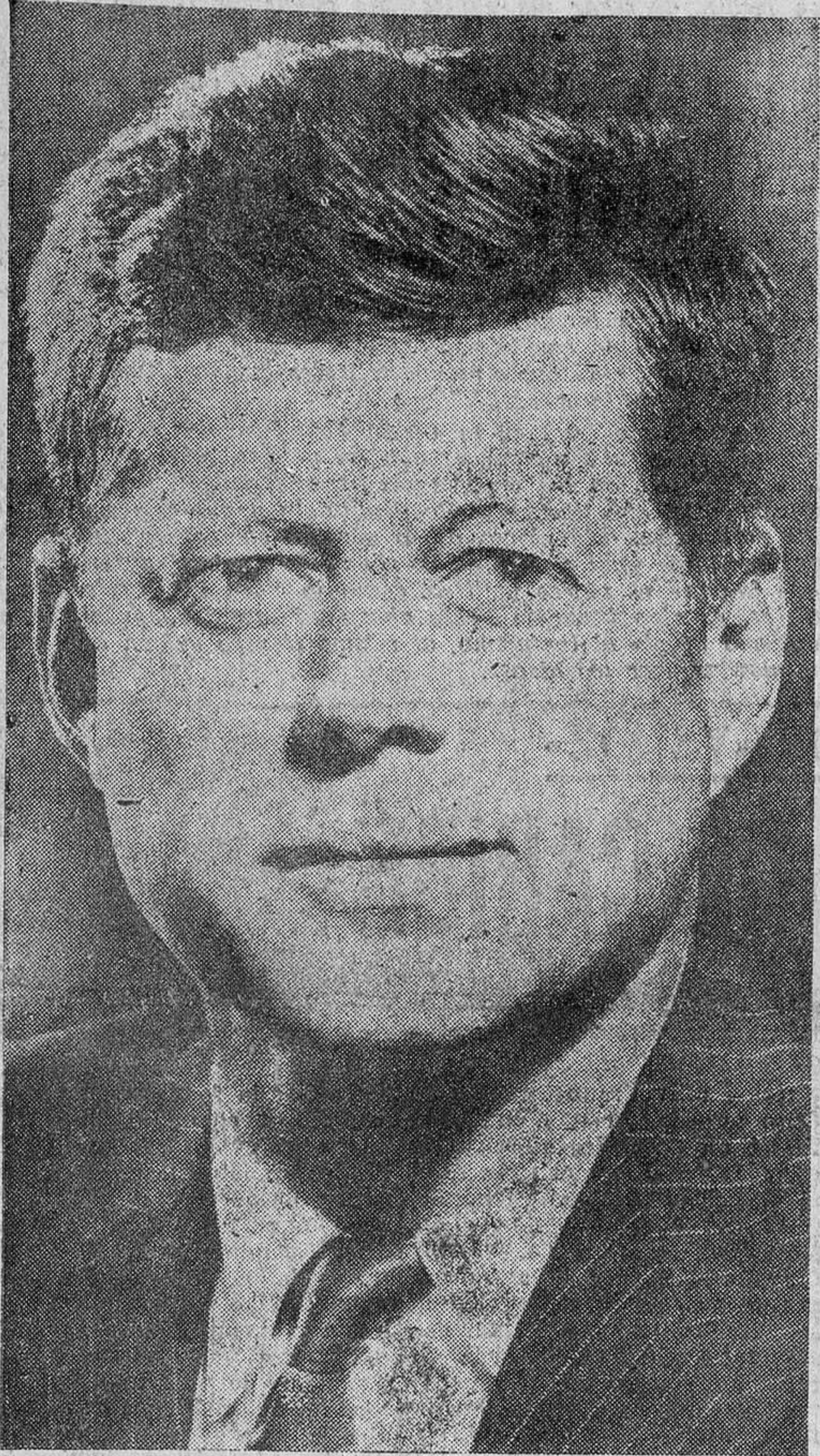
Justicia y hermano del Presidente Robert Kennedy.