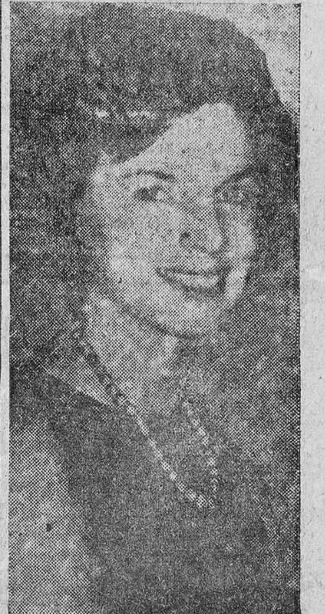
Esta joven no es la señora Kennedy. Aunque es su propia imagen y su secretaria encargada de las relaciones con la prensa.