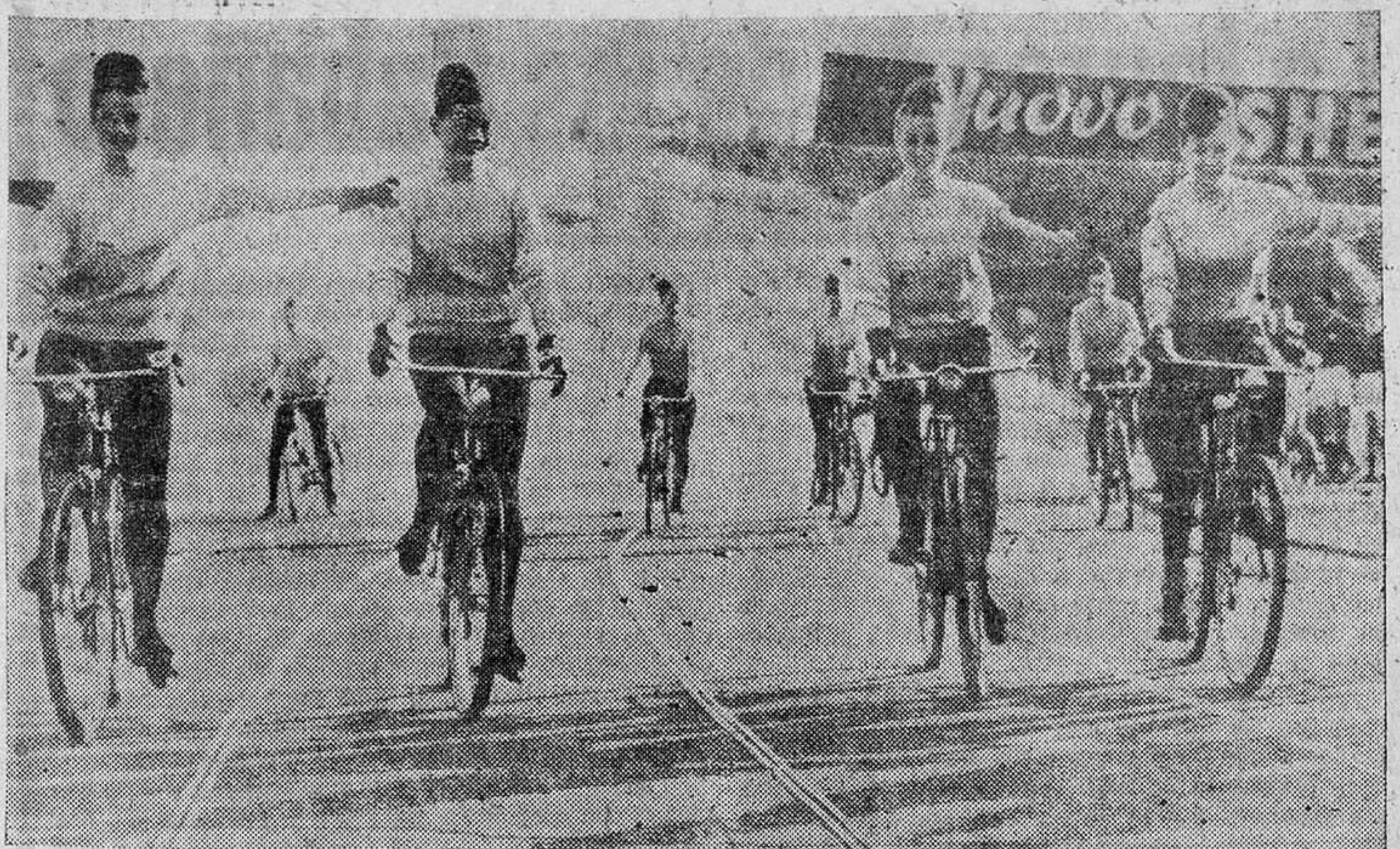
En Génova, y en su Estadio de San Martino, tuvo lugar hace poco esta manifestación, no propiamente deportiva. Las “Bluebells” bailarinas de la compañía de Carlo Dapporto, se exhibieron para un fin benéfico en una carrera ciclista. Aquí, algunas de las participantes improvisando una figura de danza en bicicleta, mientras dan la vuelta de honor.