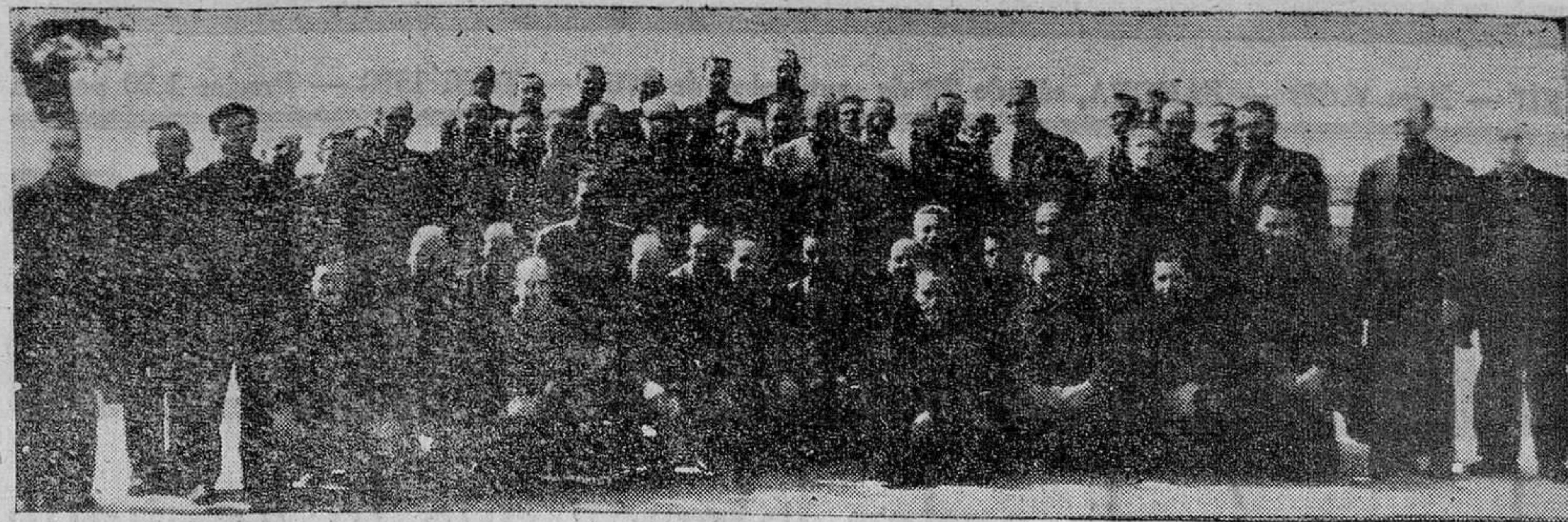
El grupo de cursillistas con las autoridades provinciales.

Volvéis a vuestros pueblos a trabajar para vosotros, para los vuestros, pero también para la Patria que os honró al permitir el honor de nacer en ella. Vayan, pues, vuestras preocupaciones no sólo para los asuntos particulares, sino también para la sociedad a la que pertenecéis, porque, lo que