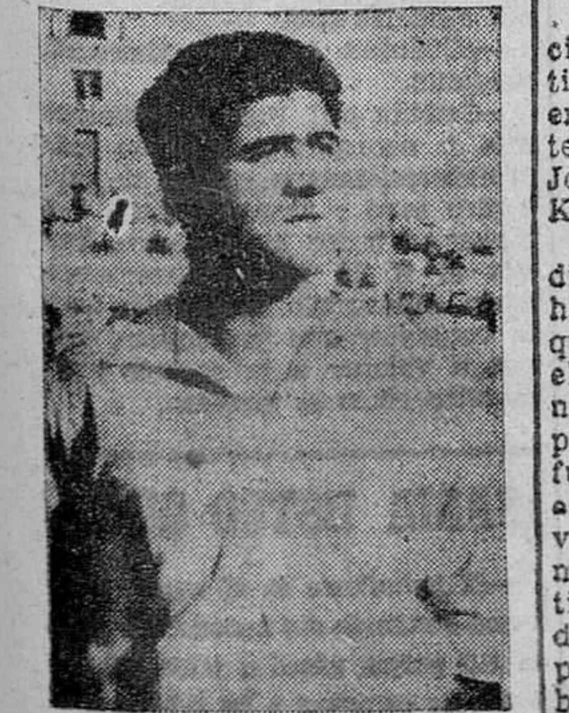
Carro, con rotura de menisco.

Naturalmente, ninguno de estos cuatro jugadores podrá desplazarse mañana a Burgos, donde el equipo zamorano se enfrentará al titular, lo que vendrá a restar grandes posibilidades al Atlético. Menos mal que,