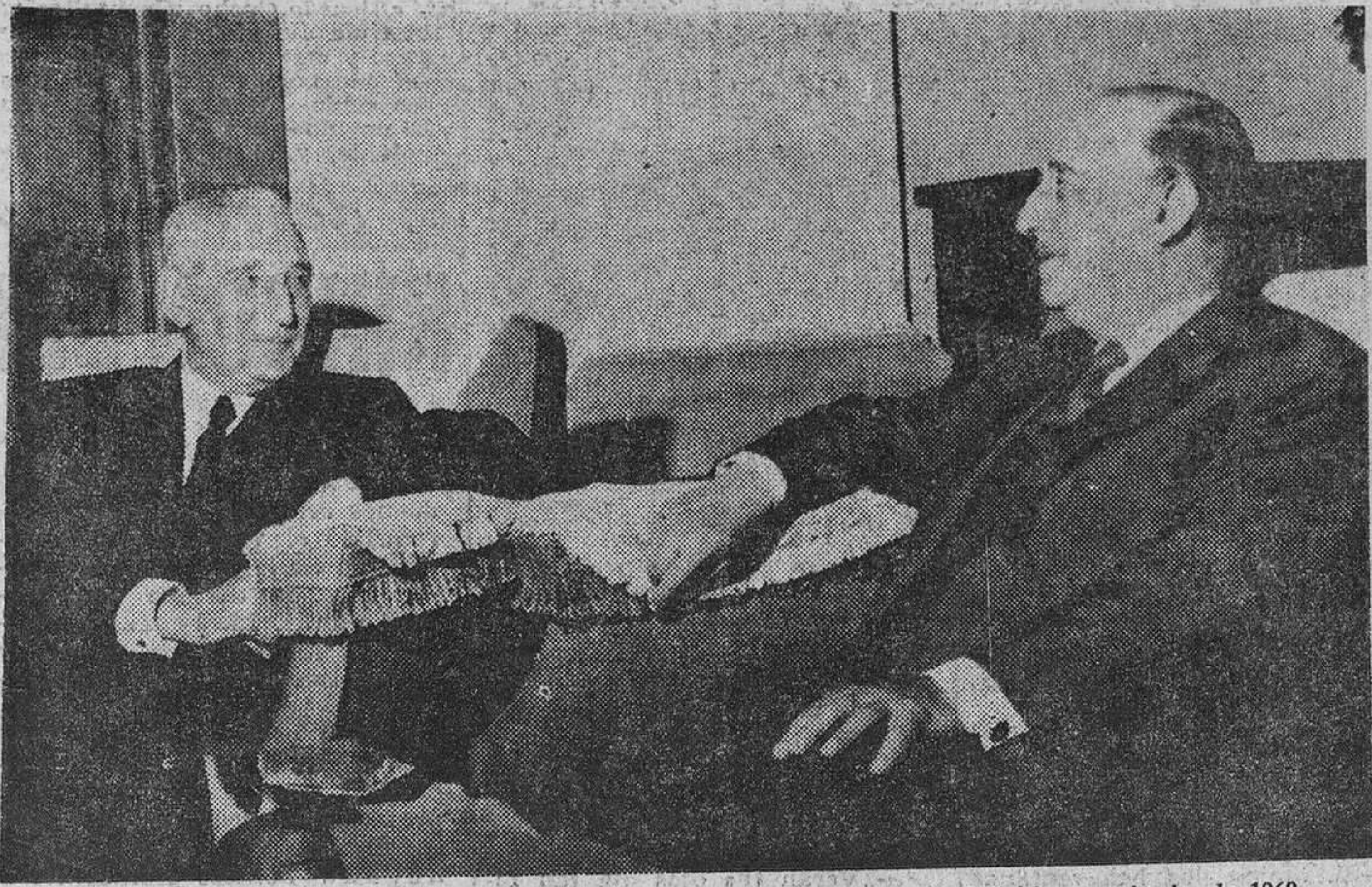
Franco y Salazar, durante la entrevista también celebrada en Mérida en junio de 1960