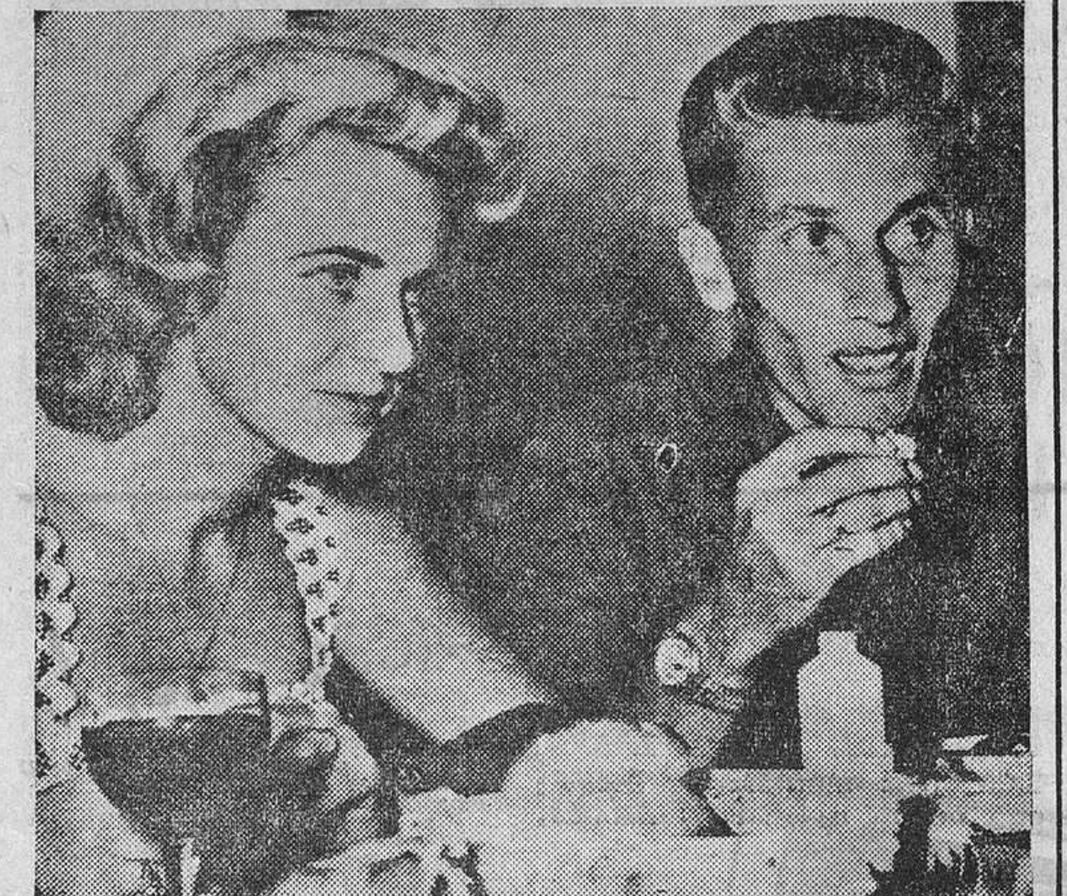
Anquetil y su gentil esposa, que le acompaña durante el recorrido de todas las grandes pruebas donde participa el gran campeón.