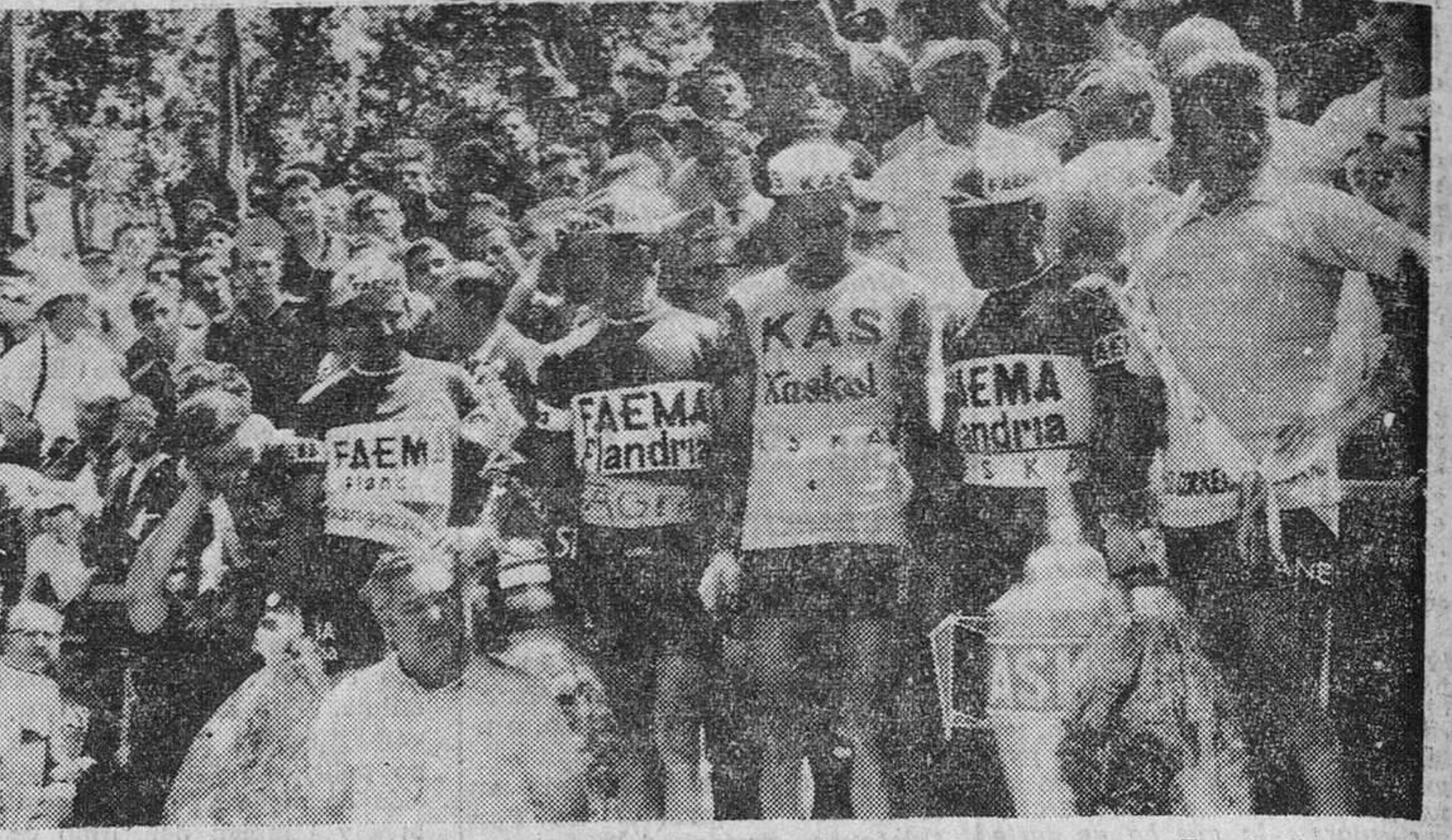
MADRID. — El corredor normando Jacques Anquetil, vencedor absoluto de la Vuelta a España, fotografiado en la meta de la Casa de Campo, con los vencedores de la montaña, de la etapa y primeros de la clasificación general.

En la novena etapa ataca Ignolin. Es el primero en pasar por Garabitas, el puerto (2) puntuable en la última etapa para el Premio de la Montaña, aunque ya prácticamente estaba decidido el primer puesto. Luego lo sigue Honrubia, seguido del belga Schroeders. A un minuto y veintidós segundos de Ignolin, el pelotón.